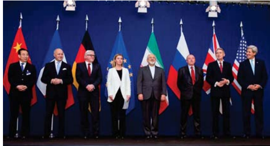
الدول الموقعة على المعاهدة

السارة الاخيرة في مجال مكافحة انتشار الديوماسي غرتي ان «تتلاق لوران سكون له تأثير إيجابي» على مناقشات عقادة الحد من انتشار الاسلحة النووية. وأضاف «سجعي إلى تسوية واحدة من ازمين كيرين في هذا المجال» في اشارة إلى الازمة الكورية الشمالية أيضا. والمعاهدة التي دخلت حيز التنفيذ في 1970 تضم 190 بلدا و كيانا وتعقد مؤتمر متابعة كل خمس سنوات. وبين الدول التي تملك سلاحا نريا رسميا وبشكل غير رسمي. وحدها الهند وباكستان واسرائيل لم توقع للعاهدة. والمعاهدة هي الولايات المتحدة وروسيا وفرنسا وبريطانيا وروسيا والصين والهند وكوبا الشمالية من العاهدة. و2003 واجرت منذ ذلك الحين ثلاث جارب نووية. وعبر الدبلوماسيون والجزء عن خيبة