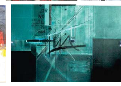
صدام الجميلي - فنان تشكيلي