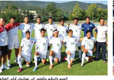
الصم والكم يتأهلون إلى نهائيات كأس العالم