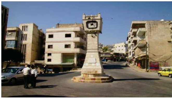
المنصرة تدخل جسر الشغور

وحدا الجيش والقوات المسلحة على إرهابيين من تنظيم «جبهة المنصرة» شمال لى لال واجهت محاولة تسلل إلى لى مشمش قرية المشرفة الشمالية والقتال بالقرب منها. كما استهدفت أوكار وجمعات إرهابيين في قرى أبو حواديت والغنطو وعز الدين بنطقة تلبيسة». من مصادر عدة أن معارك دارت بين