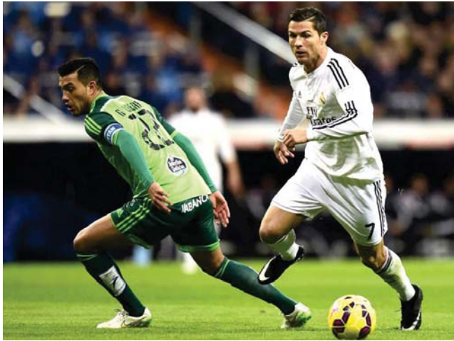
لقطة من مباراة سابقة للريال أمام سلتا فيغو

ملعب الأجر (الابديوس) في الجولة 33 من الدوري الإسباني ويحل الفريق الملكي في المركز الثاني باللقب برصيد 76 نقطة بفارق نقطتين فحسب عن غريمه التاريخي برشلونة للتعادل بـ76 نقطة. وشارق سبع نقاط عن الترتيب الثالث وله 69 نقطة. وحصد آخر أربع انتصارات متتالية في فوزا متتاليا من خصميه فرطية بهدف تحف خلال المباراة التي جمعتهم مساء أول امين ضمن منافسات الجولة المرحلة 33 من الدوري الإسباني الممتاز لكرة القدم. وبين انتصارات بلباو بهذا الفوز تجسم الفريق يمتضيرا التي سجل هدف المباراة الوحيد في الدقيقة 56. وبهذا الفوز رفع الترتيب بلباو برصيد إلى 46 نقطة في المركز الخامس فوقها. وحصد ريد طريقة عند 20 نقطة في المركز الأخير وأقرب بنقطة من الهبوط للعب في دوري الدرجة الثانية. تلك نفس الترتيبات التي مورينو مدرب تشيلسي الإنجليزي وجوده مفاجئا مع فريقه السابق ريال مدريد الإسباني بشأن النجم البلجيكي إدين هازارد. وقال مورينو في تصريحات صحفية أنه غير متشغل بشاغلات إعداد هازارد إلى ريال مدريد. فقد عدده معًا وقت قصير. ثم توجهه نواصة نحو رأسه ليقوم العمل. إنه سعيد للغاية في ذلك. بعد تأهله لنصف نهائي دوري أبطال أوروبا عقب خاوية جاره اللودون أنتلكتو مدريد في ربع النهائي. بركز حاليا على الاستعداد لمواجهة سلتا فيغو مساء اليوم الأحد على