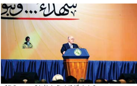
العبادي في أثناء كلمته بذكرى استشهاد السيد محمد باقر الحكيم

بغداد - رياض عبد الكريم: يبدو ان تصاريب التصريحات والوفاة المتتالية لبعض المسؤولين السياسيين التي استهدفت الحشد الشعبي ووجهت لها بعض وسائل الاعلام دفعت برئيس الوزراء جبر العبادي الى ابداء امتعاضه ما استعاضها "الأصوات" والصحبات التي تتكلم عن وجود ميليشيات في العراق" وفيما جدد رئيس الوزراء العبادي التأكيد على حصر السلاح ومحسوبيه الدولة ولا توجد جهة تدعو خلاف ذلك وأشار إلى الحشد الشعبي هيئة رسمية تابعة للدولة أكد عدم وجود ميليشيات في العراق وقال العبادي في كلمته له خلال احتفالية "الشهيد العراقي"