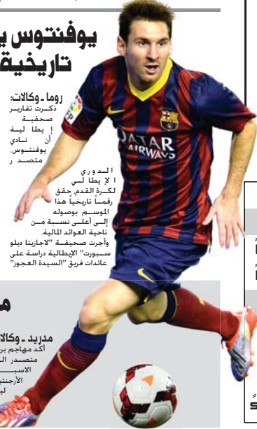
الدوري الإيطالي لكرة القدم حقق رقما تاريخيا هذا الموسم وصوله إلى أعلى نسبة من نجاحه العام المالية. وأجرت صحيفة "الديليتا ديلا سبورت" الإيطالية دراسة على عائدات فريق "السيدة العجوز"

روما وكالات: ذكرت تقارير صحفية أن يطة ليرة أن نادي يوفنتوس. متصدر الدوري الإيطالي لكرة القدم حقق رقما تاريخيا هذا الموسم وصوله إلى أعلى نسبة من نجاحه العام المالية. وأجرت صحيفة "الديليتا ديلا سبورت" الإيطالية دراسة على عائدات فريق "السيدة العجوز"