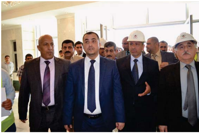
جانب من زيارة الوزير الى احد المشاريع

تواصل الملاكات الهندسية والفنية في شركة الفاو العمل في تنفيذ مشروع القبة السكني في محافظة البصرة