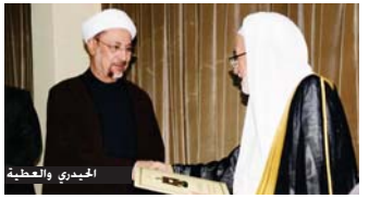
الشيخ خالد العطيبة