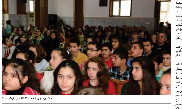
مشهد من احد الكنائس "ارشيف"

عبدوا الى يبارهم ويوتهم ومخافتاهم التي شربوا وهوروا منها بسبب الارهاب الذي دخل عليهم فحما ليحول ايام سعادتهم الى حليم.