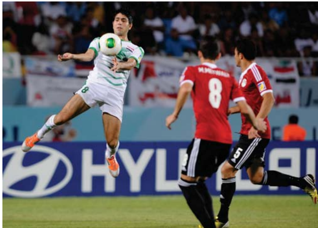
جانب من مباراة سابقة لمنتخبنا الوطني أمام مصر

مستمرات أجاج عمل اللجنة ما يسهم في تطور الفرق للاعبين الفراعنة الذين ترمي أن يتشكوا