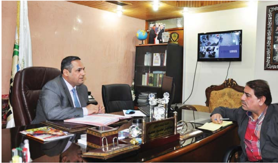
المساعد العلمي لرئيس الجامعة العراقية مع المحرر