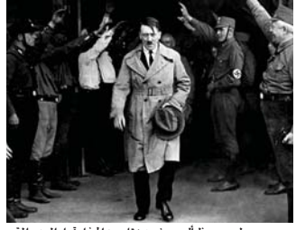
لسوء حظ ألسر. خرج هتلر من الحفل قبل الموعد المقرر

في السقوط (عام 2004) وبينما في عام 2013 وبفضل هذه المصادفة العجيبة تمكن هتلر من النجاة بقيادة ألمانيا خمس سنوات أخرى من الحرب التي سببت خرابها وخراب معظم القارة الأوروبية تهايك عن آسيا ووصفت صحيفة فولكشير