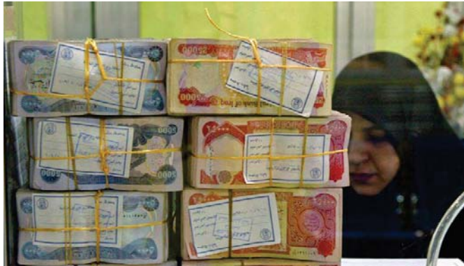
اجراءات الحماية الاجتماعية تكشف المتجاوزات

شؤون المواطنين وذلك بتحديد الدوائر الخدمية يوماً مخصصاً لمعالجة المواطنين من قبل المدير العام لتلك الدائرة ومتابعة طلباتهم بنحو مباشر للوقوف على الموقوفات التي تخول من دون تكرار معاناتهم وإيجاد الحلول المناسبة لتلك الموقوفات.