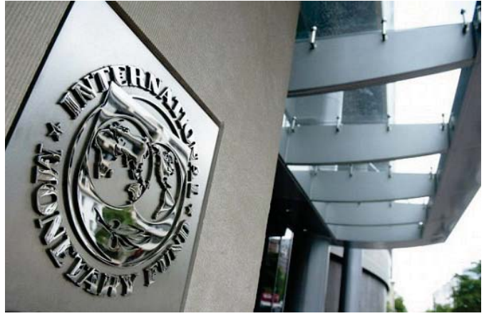
واجهة مبنى صندوق النقد الدولي

القريب يبدو محدوداً في الوقت الحالي. وأضاف «لكن تدهور الوضع الأمني سيضطر بالقدرة الفنية والإدارية على زيادة إنتاج النفط وضارته في الأجل المتوسط».