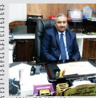
مدير عام دائرة مدينة الطب الدكتور جليل الشمرى