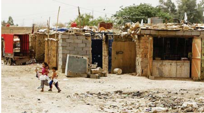
جانب من بعض العشوائيات في بغداد "ارشييف"

بصورة افضل حيث يضم قطاع كبرى عدد (4) وقاعة اشتراكات فاعة حصر الحيد و فاعة حصر المواد الانشائية و فاعة حصر مواد البناء... واضاف ان المشروع يعد من المشاريع المهمة التي تنفذها دائرة الماني والتي يساهل في قبل الللاكات الشرية المنسولة عن تنظيم واعداد مواصفات البناء وضمن معايير واسس عالية وتطبيقها لاول مرة في العراق... كما اعلت وزارة الاعمار ان الللاكات الهندسية والفنية في شركة المنصو العامة وشرفاء دائرة الماني الناعين للوزارة عززلت العمل علىرصة مجمع التوسلات السكني في محافظة واسط وبسندة اذار بلغت 52% وكلفة 69مليار دينار وقال مدير المركز الاعلامي للوزارة والكهربائية.