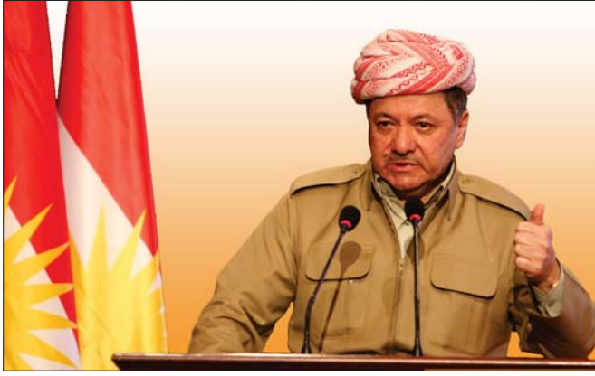
رئيس إقليم كردستان مسعود البرازاني «ارشييف»

« فيلوني: الوضع في بداية هجمات داعش كان سيئا جدا لكنه اختلف الآن وتطور نحو الاحسن، ومع أن قوات البيشمركة لم تمتلك الاسلحة الكافية إلا أن عقيدتهم كانت اقوى وسخرها كل قواهم من أجل خدمة الانسانية والحريية وحماية حياة الاخرين ولهذا انصرت البيشمركة، والنازيون اليوم يعيدون عن الخطر» »