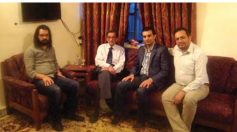
من أجواء الزيارة

وقميتها في المجتمع مستذكراً مقلعاً شعرًا، كتبه مساعداً يرى فيه جسيماً، تهاجسه الخالي: "أخشى على المعنى من العوام".