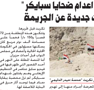
مقابر جماعية لضحايا سبايكر في تكريت