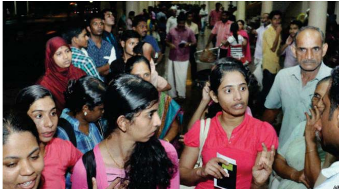
مواطنون باكستانيون بعد عودتهم إلى البلاد

بعد عودة أكثر من 800 باكستاني إلى بلادهم