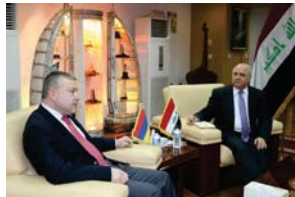
وزير الثقافة مع السفير الأرميني

عمق العلاقات التاريخية والثقافية وعلى المستويات كافة، هذا ووجه السفير كريكورسيان دعوة رسمية إلى الوزير واداري للمشاركة بؤخر يعقد في حزيران المقبل بعنى بالثقافة برعاية اليونسكو في أرمينيا. وأعرب السفير عن حرص أرمينيا على المشاركة والأنشطة والفعاليات الثقافية وذلك لأشراكها بالكثير من المهرجانات والفعاليات ومنها دعما واداري إلى نقوية العلاقات وإقامة الفعاليات والأنشطة الثقافية في الكثير من المحافظات العراقية التي تشهد استقرازا آمياً مبنياً أن "أرواب الوزارة مفتوحة من أجل تبادل الخبرات والعلوم الثقافية بين البلدين، وشهدنا