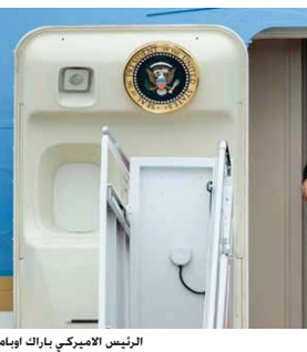
الرئيس الأميركي باراك أوباما

أوباما كبيرة في سبيل تلك حيث تعتبر هذه الصفقة من أهم إنجازات السياسة الخارجية الأميركية منذ عقود مضت والكونغرس يرى أن الرئيس أوباما لا يريد إشراك أعضاء البرلمان في القضايا السياسية العامة» وكشف مسؤول آخر عن «خاوف كثيرة على البيت الأبيض مواجهتها من قِبل جمهوريين من الجمهوريين وعلى من الحزبانين خلال الأشهر المقبلة» التصويت على الصفقة للمرة الثالثة للكونغرس يعرف جيداً أن له دور مهم في القيام به بينما الإدارة الأميركية لا تعترف بهذا الدور إلا أن البيت الأبيض يقول إن كل ما هو مجرد وضع خطوط عريضة نحو التوصل لاتفاق. ويصطدم أوباما ببعثات داخلية يضعها الكونغرس و هو الأغلبية الجمهورية. يهدد بحاج واستمراره اتفاق إيران. في هذا السياق. يحاول الرئيس الأميركي عبر اتصالاته إقناع