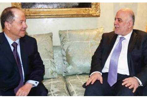
حيدر العبادي في لقاء سابق مع مسعود بارزاني "رشيف"