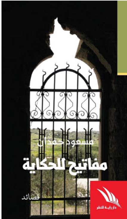
غلاف المجموعة الشعرية

يركب الشاعر إلى الصوت الواحد وإلى الناكدة الواحدة كالتجنيب لتشدان ظهره، القصائد وتستعديان صور المكان، فلسطيني عبر أسنانه وحدثت قصته ونفي فلسطيني عنه. تسعى هذه الصور المراكمة في الذاكرة نحو قلب الآلة الاستعمارية والنزور الممطية التي تميز بها علاقة الأهل بالحل. فلسطين التي ترسمها هذه القصائد، تبدو شرسية بذاكرة جلالة، تعزّي الخمل وظلمته وسوطه وفي مؤخرته كل حساب، وكأها محاولة نفي تعهده تسلطه وأخفى وتكتيك، ما سلكه من خلال استنساخ الذاكرة الجمعية ورفضها والاحتفاء بها.