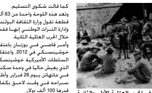
يويمات جنود وضباط شاركوا في الحرب العالمية الأولى والثانية

كما قالت شكوي التسليم. وتعد هذه اللوحة واحدة من 63 ألف قطعة نزلت وزارة الثقافة البولندية وإدارة التراث الوطني لها بعدت خلال الحرب العالمية الثانية. وأمر قاضي في بوزنان بإتخاذ خويندسكي في 2012 واعتقدت السلطات الأمريكية خويندسكي الذي يعيش حالياً في وحدة سكنية في ماثوان يوم 26 فبراير وأطلق سراحه في وقت لاحق بكتامة قهراً 100 ألف دولار. ووجهت القاضون الروسي بقول محاموه إنه أصعب تلك الفنون للوحة بعد أن ورثها عن أبيه والذي علق اللوحة لسنوات في شفته السكنية في ليننغراد وتوفي فيها عام 1943. أصبحت جزءاً من مستوع الإخاد السوفيتي السابق.