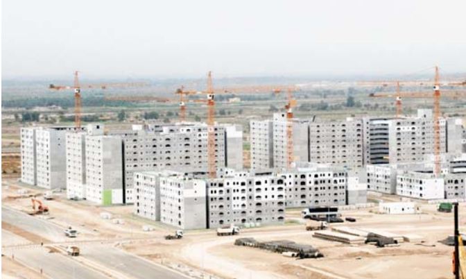
جانب من مشروع بسماية السكني "ارشييف"

أشاد رئيس الهيئة الوطنية للاستثمار بموقف الشركة الكورية المتميز بمراحل تنفيذ المشروع والوقت الامتداد الذي مر الطور الرابع للصعبة التي مر بها العراق