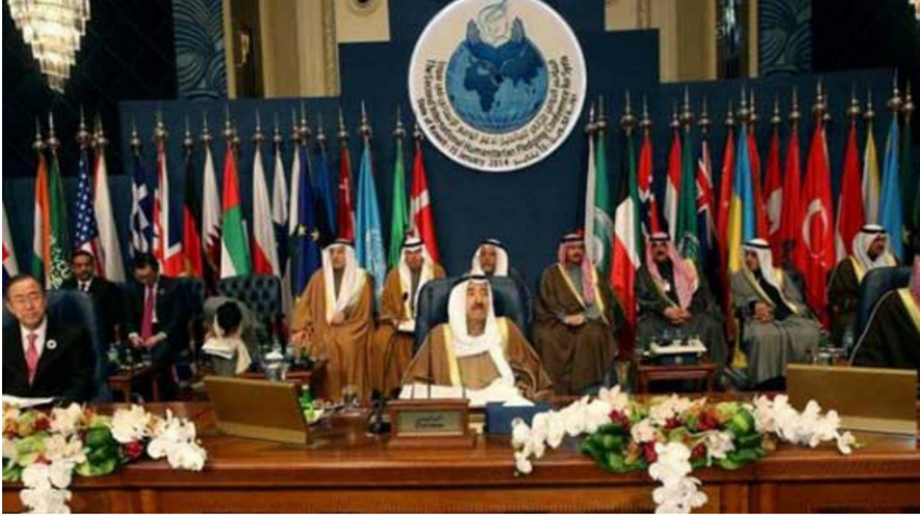
جانب من القمة العربية

التركيز على أهمية تطوير قدرات المجتمعات المضيفة للاجئين المصريين، وبحصول على الخدمات الصحية في قطاعات الصحة والتعليم، وهي القطاعات التي حظي بدعم مالي كبير من الحكومة المصرية وتقدم الحكومة خدماتها في تلك القطاعات دون مقابل». وأشار البيان إلى أن شكري يؤكد خلال مشاركته في المؤتمر على دعم مصر المسار المزدهج الجديد خطوة الاستجابة الإقليمية للاجئين السوريين 3RP، والذي يعتبر الأول من نوعه من حيث