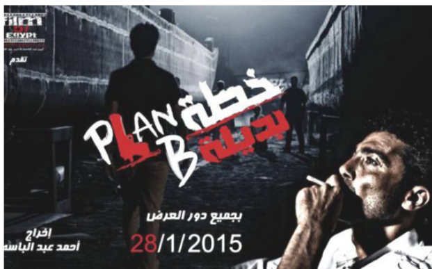
الملصق الدعائي لفيلم خطة بديلة

بعد أن يتأكد من عجز القانون عن الإتيان بحقه، ليكتشف عن ما يعاينه القانون من تغرات دأب زميله طارق (الممثل تيم حسن) على استغلالها لكسب القضايا التي يتولاها. ليشرّب من الكأس ذاته الذي شرب منه زميله عادل، بعد أن يتعرض لحادث مشابه يتم فيه الاعتداء على زوجته. رغم ما انسمت به فكرة الفيلم من قوة، إلا أن الدرجات التي منحها الجمهور للفيلم لم تتجاوز 6 درجات، لأنهم عوّوا أن أداء تيم حسن جاء «باهتا»، وقالوا إن قصة الفيلم بشكل عام جيدة وصاحبها ركافة في طريقة سرد الأحداث.