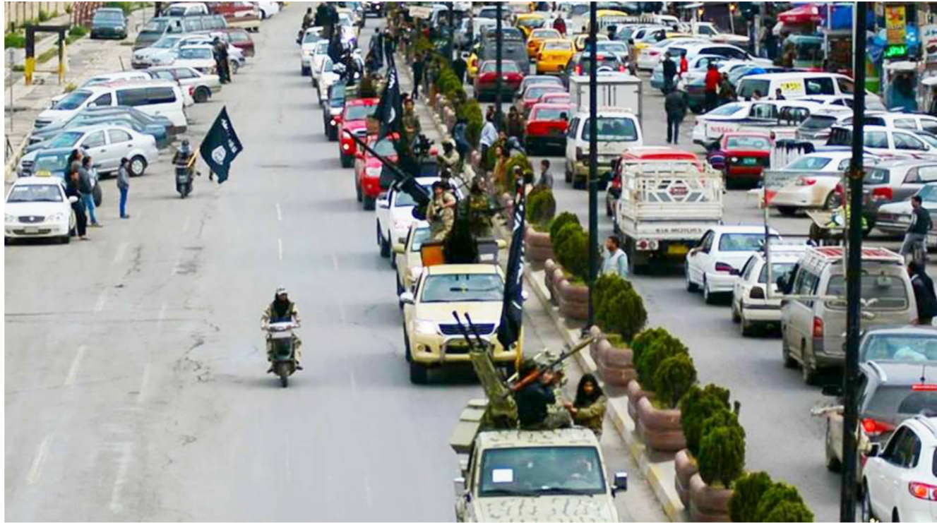
عناصر داعش في شوارع الموصل

واضاف "من المرجح ان الطيران الحربي بدأ باستخدام مقذوفات وصواريخ تختلف عن ما كان يستخدم سابقا في ذلك مواقع التنظيم، ونحن نعتقد انه يتم القصف بواسطة ما يسمى بالقنابل الارتجائية والتي تحدث انفجارات يصاحبها صوت غير مألوف". ولفت المصدر الى ان "القنابل الارتجائية تؤدي وظيفتين بأن واحد الاول انها تدك المواقع