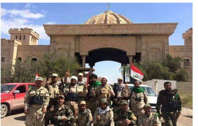
الحشد الشعبي في تكريت