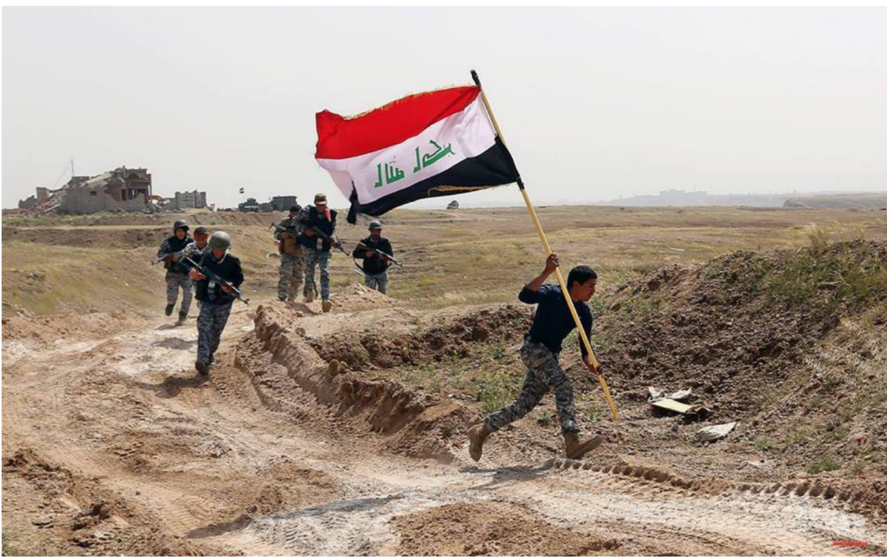
العالم العراقي يرفرف على اراضي تكريت

وبهذا السياق أكد الدكتور حيدر العبادي، أن مدينة تكريت، حررت بدماء العراقيين وحدهم، واستطعنا أن نأخذ الدواعش