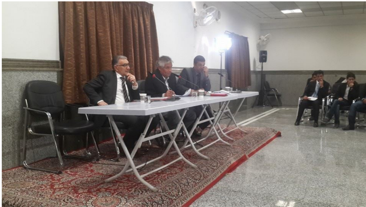
من أجواء الجلسات النقديّة لمهرجان النهج

نتائج المسابقة أربعة وثلاثون فيلما عرضت على مدى أيام المهرجان وتنافست على أربع جوائز ثمانية منها كانت خارج المسابقة، وجاءت النتائج كالتالي: الجائزة الأولى: فيلم "ليتينا كنا معك" للمخرج اللبناني حسين أحمد سماحة الجائزة الثانية: فيلم "ماشتي" لإسماعيل للمخرج الإيراني مهدي زمانبور كياسري الجائزة الثالثة: فيلم "الصندوق العظيم" للمخرج العراقي هيثم حسن مزعل جائزة لجنة التحكيم: فيلم البالونات للمخرج العراقي خالد البياتي ووزعت كذلك شهادات تقديرية على لجنة فزر الأفلام ولجنة التحكيم، وأعلن رئيس المهرجان حيدر جلو خان عن البدء في التحضير للدورة الثانية منذ الآن وحدد موعد نهاية أيلول المقبل لاستلام الأفلام المشاركة والذي ستتمثل قناة كربلاء جزءاً من نفقات إنتاجها. المهرجان كان ناجحاً بمقاسات الجوائز السينمائية، ومن المؤكد إن القائمين عليه سينتدركون ما رافق هذه الدورة من أخطاء.