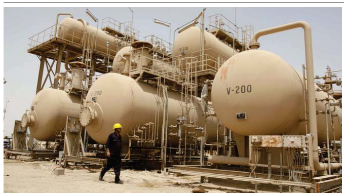
احدى الحقول النفطية في البصرة

إيرادات إضافية في القطاعات الأخرى، فيما أشار إلى حرص القطاع على حل العقبات التي تعيق عائقاً أمام الشركات العاملة في تدليل «الوزارة تبادل جهوداً كبيرة في تدليل الصعوبات التي قد تعترض عمل الشركات الأجنبية العاملة في العراق ضمن جولات الترويجية». وكان رئيس الوزراء جواد العبادي أكد أن حكومته ماضية بزيادة الإنتاج النفطي إلى جانب البحث مع