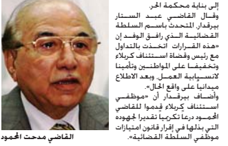
القاضي محمد المحمود