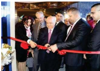
وزير الثقافة فريد راوندوزي أثناء حفل الافتتاح

العاصمة بغداد. لافتاً أنها «كانت موهبة وتنتج منذة ثلاث قوائم الوزارة بتكليف المدير الحالي عقيل المسلاوي بإيرتها وتعهود بدعمه لينجح بمهمته». وعسا الوزير من خلال الاحتفال بهذه المناسبة إلى «الاحتفاء اجلالاً وإكباراً لشهداء الجيش والحشد الشعبي والبيشمركة. الذين ضحوا بأنفسهم من أجل أن لا يحصل الأذى عن أي فرصة لتعكير الحياة». وأشار راوندوزي إلى «الأعمال التي عانت الدار منه منذة فترة. وإن التغييرات التي تمت عليها كانت ضرورية متعمداً بأنه لن يترك حصة الدار إلا وان تقوم مرة أخرى