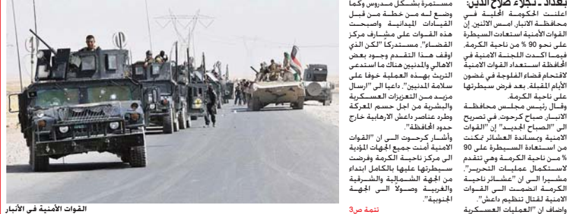
القوات الأمنية في أربيل