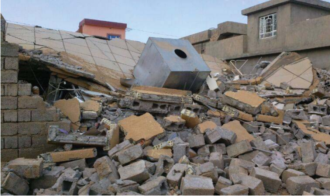
أحد المنازل المحررة جراء الأعمال الإرهابية

المجهرين في مجلس ديالى والجورجى الى اجتماع ادارة ديالى بمجلس الوزراء امر ضروري من الاجل تفعل التنسيق في الملفات الجوية وخاصة النازحين. الامر بالمع اهمية لان هناك آلاف النازحين وضع انساني معقد وصعب للغاية، وبحثا امر إعادة العائلات الى جملة من القرارات خاصة في ملف تأمين اعمار المناطق المحررة وتوفير الخدمات الاساسية اضافة الى تأمين تعودتات منسفة لن تضرر بغفر جازم دامت والعليات يعكس.