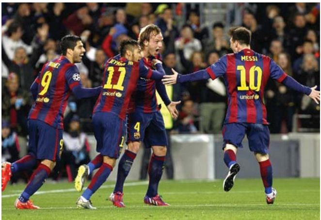
فرحة لاعبي برشلونة بالفوز على ريال

رسال مدريد على مسار 11 مباراة شارك بها سواء بقصص الفريق الكلاسيكو أو نابه التسابق ريال وأضفت أن الحارس التشيلي ناق 9 مرات مقابل تعادل وحيد وذلك في مباراته رقم 200 بالدوري الإسباني لكرة القدم "الليجا". ولقدت الصحفية المرديية إلى أن براهو نائق بشدة في كلاسيكو الأحد وأدقاً 4 فرص محققة من أقدم نهائي هجوم ريال مدريد كيرستيانو رونالدو وكريز برنار وأضادت أن ريال كلابوسو يرافسو احتفل أيضاً في كلاسيكو بمبارته رقم 200 في الليجا إذ حسمي عرس الريايسا في 28 مناسية مقابل 172 بقصص ريال سوسيداد.