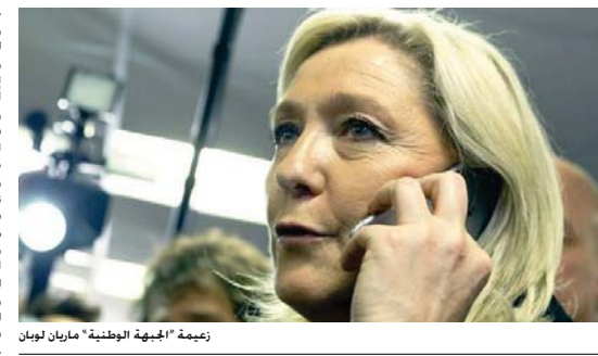
زعيمه "الجبهة الوطنية" ماريان لويان

حازت على أصوات أقل من المتوقع، وقال إن هذا يؤكد أنها ليست القوة السياسية الأولى في فرنسا. وطالبت لويان باستقالة فالس قائلة إن أداء حزبها كان جيدا، وتفق على أدائه في انتخابات البرلمان الأوروبي. وتعني النتائج الأولية أن اليمين في الجولة الثانية سيكون بين الجبهة الوطنية وحزب الأتحاد من أجل حركة شعبية» حزب آخر هو الجبهة الوطنية» برعامة ماريان لويان كمنافس جاد على السلطة، حسبما يضيف سكوفيلد.