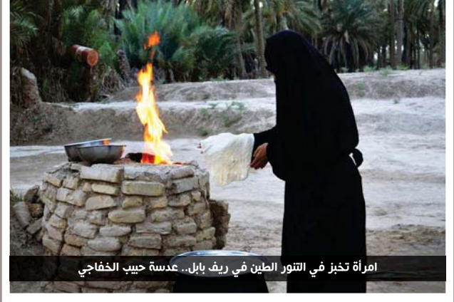
امرأة تخبز في التتور الطين في ريف بابل.. عسة حبيب الخفاجي