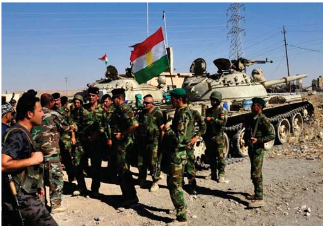
مجموعة من قوات البيشمركة " أرشيف"

اريل - الصباح الجديد: فقال رئيس اقليم كردستان مسعود بارزاني ان الشعب الكردي سيحطم أكبر المنظمات الارهابية في العالم، ويملأ اعجابه. فيما تلقى اتصالاً هاتفياً من نائب الرئيس الأميركي جو بايدن أكد فيه استمرار دعم اميركا للاقليم في جبهته ضد الارهاب. جاء ذلك خلال زيارته محورين من جبهات القتال لقوات البيشمركة ضد الارهابيين للاحتفال بعيد نوروز العبد القديم للشعب الكردي. ثم تصدق بارزاني عندما من جهات القتال في محورين ضد الارهابيين لقوات البيشمركة مشيراً الى العديد من الملاحظات المهمة للقاء وافراد البيشمركة وقال انه اراد ان يحتفل بنوروز لهذا العام مع عائلات الشهداء والبيشمركة. فهدمها شركه وامتنانته لندور النطولي الذي يليه قادة وفار البيشمركة والاطفال. مؤكداً على ان بطولاتهم رفعت راس هذا الشعب اكثر. وأشار الرئيس بارزاني في تاريخ نضال الشعب الكردي مبيناً بان هذا الشعب انتفض قبل 2715 عاماً في سبيل الحرية، منذ ان ذكوه الحداد راس ضحاك ان ذكوه صولاً لنضال عبيدائه والشهيد عبدالستلام بارزاني وشيخ سعيد سريان والسيّد رضا والشّيح محمود الخالد والقاضي محمد والشّيح احمد بارزاني والسا منصف بوسا بعديوم وان اسطورههم خستت عاى بيشمركة وشكلا وقتل وتقتل ميركيران وخزيران المضاهيا لهذا الشعب اكثر من اربع نوح تحطيمهم لاكير المنظمات الارهابية وليالها اعجاب كل دول العالم. وقال «نحن جميعا ابناء لهذه