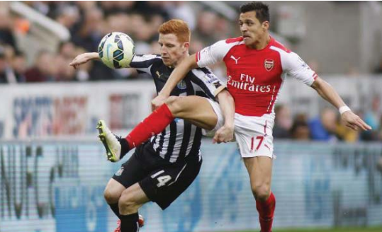
جانب من مباريات الدوري الإنجليزي