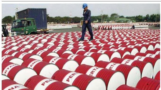
تراجع أسعار الخام بريك "أوبك"

بغداد - الصباح الجديد: قال عماد عبد المهدي، وزير النفط الأسبق، إن الحزون النفطية الأصلي في العراق تجاوز 516 مليار برميل قياسا دون حقول إقليم كردستان. وأضاف عبد المهدي في بيان نشر على صفحته على موقع التواصل الاجتماعي "فيس بوك"، إن مخزوننا النفطية الأصلي هو 516.8 مليار برميل قياسا بالاحتياط النفطية الأصلي 181.4 مليار برميل قياسا بالاحتياط النفطي لغاية الآن من 142.4 مليار برميل قياسا. وكان الثاني الماضي 2015 هو 130.97 ترليون قدم مكعب منها 32.7 ترليون قدم للغاز. وأكد وزير النفط "أن الاحتياطي الغازي الحر والمصاحب النفطي لغاية الآن هو 98.3 ترليون قدم للغاز. وأضاف عبد المهدي أن "هذه الأرقام هي تقديرات أولية، وسيتم تحديثها مع تطور تقنيات الاستكشاف والتقييم". وقال عبد المهدي إن "مخزوننا النفطي هو 516.8 مليار برميل، وهو أعلى من احتياطي الولايات المتحدة، مما يعزز مكانة العراق كمصدر رئيسي للنفط الخام في السوق العالمية".