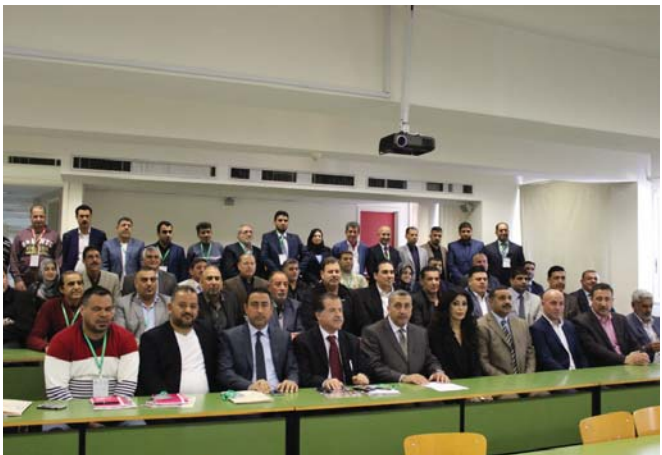
وفد اتحاد القادة في مشاركة سابقة