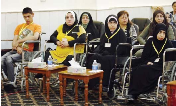
ذوو الاعاقة شرحة مهمة في المجتمع "ارشيف"

الانضمام بالانظمة والتعليمات و هدف الوزارة هو اصلاح ومبارحة الفساد الازاري والتي، سيما ان الفساد مستمر في تدعيم يد العيون لجميع الفئات المستضعفة في المجتمع.