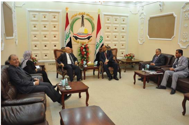
رئيس مجلس محافظة البصرة خلال لقائه الشركة الفرنسية «ارشيف»

مشيرا في الوقت ذاته ان ان التبادل التجاري والاستثماري... وأشار البروني إلى ان «العراق ومصر يتلان عنصر الامتداد في المنطقة... الكهرتائية أو التطهير ومشاريع الاسكان»