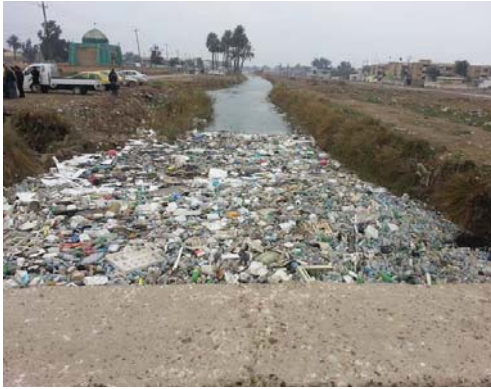
نهر "خريسان" في بعقوبة

المياه مصدر للأمراض الوبائية. ديالى غارس العرازي ان «هناك تقارير تختدع عن تنامي معدلات الفلوت في مياه نهر خريسان بسبب حجم الكيبرل للفلوات والانسداد التي ترعى به من قبل الاهالي خاصة في المناطق السكنية القريبة من ضفاف النهر». وقال العرازي ان «دائرة اطلقت مأسسة، برامج معالجة في السنوات الأخيرة من أجل ضمان مياه نظيفة لتزويد أهالي بعقوبة ولتأمين مياه الشرب خاصة خريسان الذي يمثل شريان الحياة لباقية وضاويها وهناك استجابة واضحة لكنها ليست بالنسبة التي نريدها». وشهد مدير اعلام محطة ديالى اعلامية عناء حياطة طريق الدوائر وحتى منظفات المجتمع المدني من أجل حماية بيئة النهر. وقال في ان «رؤية النهر نظرا امر صعب ويهدد بمرور امراض ووبئة كثيرة».