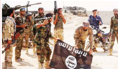
القوات الامنية تنزل علم داعش