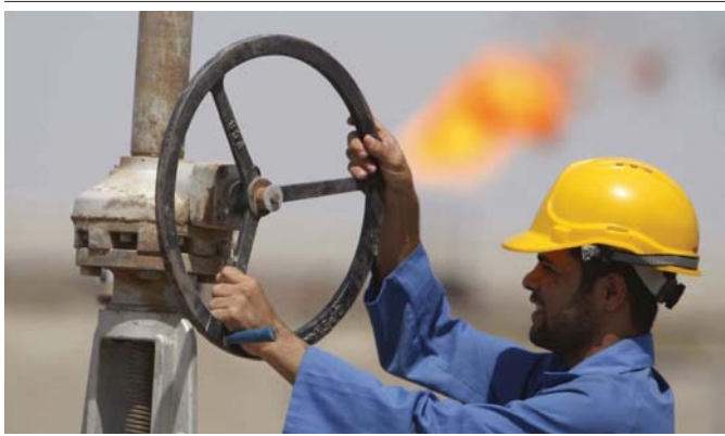
"النفط" ماضية في تطوير الحقول وزيادة الانتاج