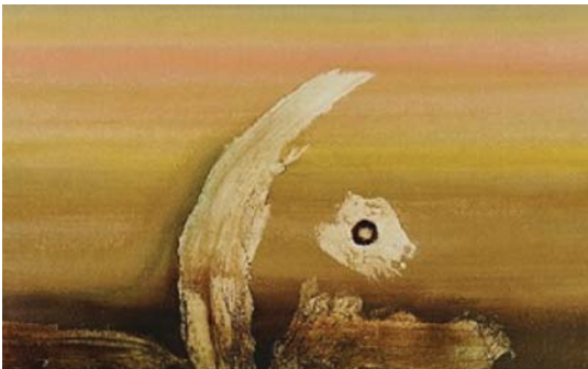
لوحة لفنان الراحل رافع الناصري

النومي بصورة) التي كانت تنسب إلى عبد السلام وكان متأثر بنحو ما يهذه المجلة البرناسة (الكث مغروسا في أمتكهم وهم جرا سطره هذه الأريحية التي كان يحكم سحرها أبو الفخر عمدا أكثر برفع عبقريته بخصوص عدداً لمحدود من الخرافة أو الجنود الذين كان يحركهم فعمل الفنان بين المواضيع في الغالب بين براقص وتسايطهم وبطري عليه لم يكن بحس بأساسة كونه حالة أم أن كان تلك إحدى صفاته الممتازة أو فسننا ذلك بيزان العذلة إحساسه بنيل الفنان كان مدام ولم يكن لك أحد من تطلعاته بالحس مؤثرة أفاضة الصبورة لم يكن تلك النهج من عفة ووجه الظفرة في سماء العاطف الجود كاتبا ينظرون لأراجيحها الهوائية البالغة الحسة.