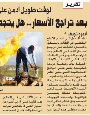
مشفاة نفطية عراقية "الشيخ"

أندرو توف: بدأت الدول التي تصدر الاناج النفط في العالم بالشعور بالخساسة الناتجة عن تراجع اسعار النفط في العالم بعد المائتة التي كانت في الاوقات الجميلة. توفر رخصة جيدة حكومات تنفذ على البرامج الاجتماعية التي تنفي التماس شعابين بالمساعدة والسلمية. ولا كان ثمة سكان يتجلى هذا فيه فانه بالتاكيد سيكون الشرق الاوسط حيث قامت الحكومات هناك بتسعين خزائنها بواسطة الوصايا الرسمية وفق نظام غنائي ثابت من عائدات النفط والغاز. ما جعل مواطني هذه الدول من