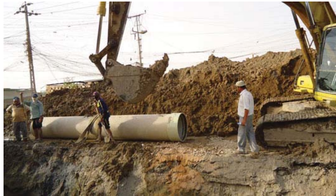
أحد المشاريع الخدمية في المحافظة

والمستشفى الحديث في منطقة وشارع نائب محافظ ديالى الى ان «الحكومة الخدمية بانت على فدر عالية في ختم مسؤولية ادارة الملف الخدمي من خلال وجود خيرات متراكمة للمستشفيات الخدمية» مبينا ان «نقل الصلاحيات امر بالغ الأهمية وسيستلزم في معالجة الكثير والبناء، لان الرقابة مستكنة مستمرة إضافة الى كافة الخلل وتنسيق موجودة وفقا للقانون والصلاحيات.