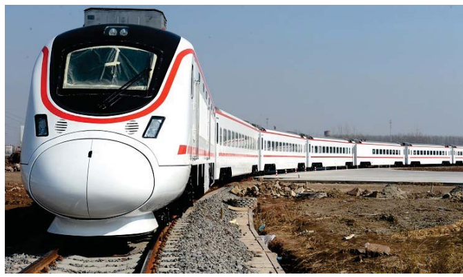
القطار تستعين بمقطارات صينية لتطوير مساراتها