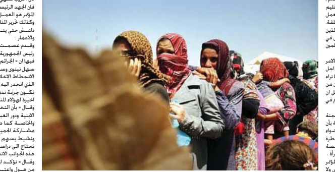
مجموعة من الناجيات الايزيديات "ارشيف"

دهوك - الصباح الجديد: دعا المشاركون في مؤتمر لالاش للسلام والتعايش المشترك الذي عقد في دهوك في ضويرة الشرق والعمل بوضع التنازح المختلفة لمساعدة النساء الايزيديات الناجيات وبذل الجهود لتحرير المخطوفات والعمل عمادة الهيئة الخيرية للمنطق التي تدير من داعش بالنسبة المشككة حتى يتمكن الهادي من العودة اليها. وجاءت هذه الكلمات في القمت من قبل المشاركين في المؤتمر الذي نظم من قبل مجموعة النساء الايزيديات من أجل السلام في كردستان ومنظمة (MM) ودعم من منظمة (HIVOS) الهولندية. وأكد رئيس اقليم كردستان فرهاد نوروشي بان هناك الكثير من الجهود تبذل في محافظة دهوك التي اصبح مخطا انظار العالم كونها مخطفة ائمة وانتفاضة ارباب ومئات الآلاف من التنازح من كركوك والعبور والشبيقة والعمسة والسليمانية واليزيدية الذين تلقتهم نازحين لأهم في وطنهم. وأضاف فرهاد بان عقد المؤتمر في هذا المكان القمت له أهمية كبيرة وهو معيد لالاش