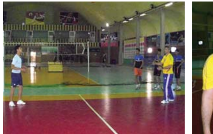
جانب من تدريبات الكرة الطائرة