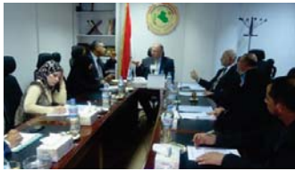
اجتماع سابق لتربية الرصافة الثالثة "رشيف"

بغداد - الصباح الجديد: ختم شعار "بالاعلام الهداف" ترفد عملنا التربوي الريس" اشاد فيها بالور الريادي والمطاء للتربية العراقية داعيا الجميع الى بذل المزيد من الجهود لارتقاء بالنشأ التربوي. واكد العبدوي على وجوب تكئين المعلم العراقي ماديا ومعنويا كي يستطيع ايفاء رسالته العظيمة في احسن وجه