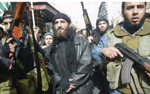
عناصر تنظيم القاعدة

سبب عدم رضاهم عن الحكام العرب فإن الجهاديين المسلمين، الذين جسدهم زعيم تنظيم «القاعدة» السابق أسامة بن لادن، فهم يعتقدون ان الطريق للعودة إلى العصر الذهبي للإسلام والمجتمع الإسلامي يكمن في الحزب المقدسة وللجماعة الإسلامية في لبنان.