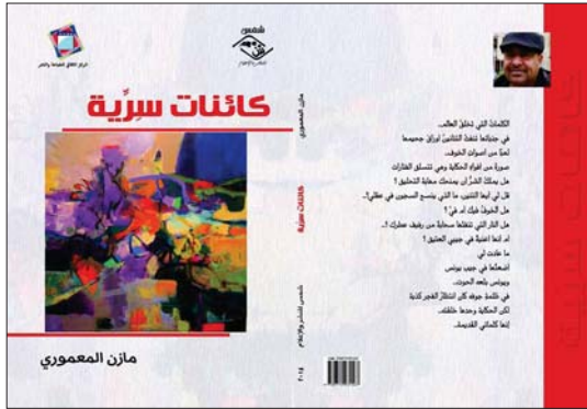
غلاف المجموعة الشعرية

لم يكف صان العسوري بعقودته مجموعته الشعرية بـ "كائنات سرية" وإنما أرح عينه ثابته معنوية بـ "قصص" وكنهه أراد به هذه العتمة الخرج عن إطار النصوص المألوفة بـ "قصص" غير مألوفة، ولكن ما حقق فيها حيازة جديدة لمستمار فارقة في كتابة قصيدة النثر؟ نتيقت "قصص" من مؤثرات بكتابات اليفة مؤسطرة على هيئة كتل متوجهة بإيجاز وكثافة ومحاكاة لتشكل على حيث تتصلب بتأطير ظاهري ضمني ترفض الجنس وتنتمي إلى النوع حيث لا شكل لها أو متعددة الأشكال تضع القصيد موضع الشك في دوال ملتصقة مع الفواقع والتخييل والسيرورة والأسطورة عبر مجازة في لغة فنيّة تؤسس العتمة مستردة على قوانين كتلية القصيدة بوعي جديد وعلى الرغم من اللفظ الغامض على استبدال المألوف بالمعنى فإن السال فيها يؤسس لما يتفرض اللغوي من خلال ثنائية التخييل والمجاز أو اللغوية وخاصة في مستوى جماليات النسيج بين الرؤية والبوي. وما يجعل "قصص" / كائنات سرية" تنتمي إلى الكتابة الجديدة لقصيدة النثر بحساسية جديدة - كونها تتكف تجزئة العلاقات اللفظية وتقطع " قصص" الذي رأى كل شيء ..