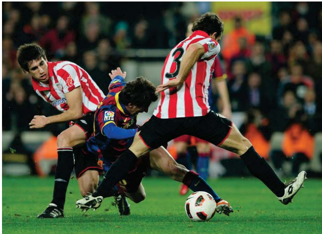
تقطعة من مباراة سابقة لبرشلونه امام اتليتكو بيليو

التعداد على أرضه بهدف. فكان التألق من نصيب أوريزغ هدف الفريق الإسباني. تكسر أن التوقيع الأخير لبرنسا كان في موسم 2011-2012 بالتوقيع على بلسا أيضا وكان النهائي الخاسق بسبب جواربولا، وانتصر فيه برشلونه بثلاثة نظيفة. من جانب آخر شارك البرتغاليان كريستيانو رونالدو وببيسي بالإضافة إلى داني كاريخال في الإسبان الجماعي لنادي ريال مدريد الإسباني لكرة القدم فيما وصل سرخيو راموس والكولومبي جيسوس روبريزجواربولا المنفصل للتغلب على إسبانيتهما وخاصة كريستيانو وببيسي وكاريخال الذين تروبو إسبانيا والرياء بمصاته الألعاب الرياضية. المران الجماعي قبل الأخير استعددا لمواجهة التكتيك بلسا في ملعب "سان ماميس" اليوم السبت في الجولة 28 من الدوري الإسباني لكرة القدم. وحسب النادي اشرك المدرب الإيطالي كارلو أنشيلوتي في المران التوجي مارزين أوبجارد الذي يشارك حتى الآن في مباريات ريال مدريد كاتسبا (الرياء) الذي يدرسه التجم الفرنسي زين الدين زيدان في دوري الدرجة الثالثة وأجسرى أفراس إيكو كاسياس وكيلور نافيرو وفرناندو باتشيسكو فرانسو خاسما فيما وصل سرخيو راموس وجيسوس روبريزج تديرات الغافي. شهد المران الجماعي الإسباني مشاركة الأناشي إسبانيا خبيرة زيدان غاب عن المباريات الأخيرة للزال.