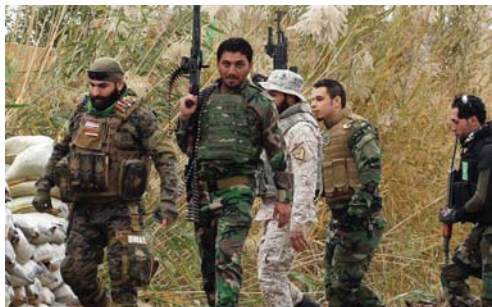
عناصر من الحشد الشعبي

طرق وعرة ذات تضاريس معقدة بشكل اتاح استمرار التقدم نحو الاهداف المرسومة نحو اى تاخير. فيما أكد رئيس اللجنة الامنية في مجلس بعالي صادق الحسيني. مشاركة اكثر من 1000 مقاتل من ابناء عشائر الجبور والشمر والعبيد في جانب قوات الحشد الشعبي الخاصة من بنالي صوب صلاح الدين من اجل تحرير مناطقه من سطوة داعش». واضاف الحسيني ان «مشاركة عناصر صلاح الدين في معركة تحرير مناطقها من افة داعش تعكس ارادة وطنية سترد بقوة على ما يحاول اشارة الثورات الطائفية عبر اكتاب وشلتاعات مغرضة هدفها