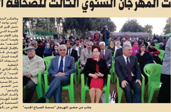
جانب من حضور المهرجان "عمدة الصباح الجديد"

كل الصحافة في العالم، نتجة هيمنة العالم الكوندي، مسيريا إلى هناك "نبوات" خصصت ليحت أمة الصحافة وما تعاني منه. على أمل الخروج بنتائج مفيدة". وتأتي الصورة الثالثة للمهرجان في وقت فيه العراق يعطف تاريخي بحساس أكثر الهجمة الإيرانية المهرجان حدثت عن التفاعليات التي أقيمت قبيل انطلاق المهرجان منها الرسوميات الكاريكاتيرية والنواعت الثقافية. وأكد الجزائري في حديثه إلى "الصباح الجديد" ان "المهرجان صارت لهجة بشعبية واسعة، حيث إن ما يزيد عن 20 صحيفة شاركت فيه فضلا عن الحضور الجيوي للمتعلمين والديمقيريين". وأشار الجزائري إن "الهدف من إقامة المهرجان هو تنشيط حركة الصحافة في العراق وسنمائها وأن تعاني من ركود. وهو ما تعاني منه