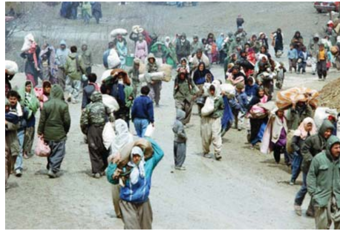
الهجرة المليونية للاكراه "ارشيف"

اربيـل - الصباح الجديد: أكد جالس وزير حكومة إقليم كردستان على وحدة الصف والثقة بالانتصار على التحديات، فيما وجه رئيس الاقليم مسعود بارزاني رسالة الى الشعب أكد فيها ان الانتفاضة هي رسالة لشكل العالم وان شعب لا يقبل ابدا بالظلم والعبودية. وقالت حكومة الاقليم في بيان لها اصدرته بمناسبة الذكرى الـ 24 لانذلاع انتفاضة آذار 1991، برغم ان اليوم في مثل هذه الاوقات الحرجة والخطيرة الذكرى السنوية الـ 24 لانذلاع انتفاضة آذار لشعبنا وفي مثل هذه الاوقات التي يقف فيها الكردستانيون في خنادق الدفاع غاربية اعنف فيون للظلم ومن جانب آخر يواجوهن ضغوطا مالية وسياسية وحربا نفسية. وأكد البيان ان «الانتفاضة التي تعدد أكثر تعبير عن رغبة وإرادة الكردستانيين في التحرر ورفض السلطة الدكتاتورية ونهج السلطة على الآراء القومية والوطنية، فهي عمل بالنسبة لنا والتكسر من أغالي العسكرة الامة وأهمها في الصورة الوطنية موفيا مع وجود أرادة المقاومة وروح الحمى والصمود». وأشار البيان الى ان «روح المقاومة والتصدي فيكم، هي روحية انتفاضتنا العظيمة نفسها مقابل هذه الحرب العنيفة من قبل داعش من جهة وثقل الأزمة الصعبة التي يواجهها إقليم كردستان التي وجهت من قبل دويل على انتم كإقليمكم للبلاد والوطن وفلكم لتلامد الشوهاء الأثران ان موفيقكم هذا دليل على الصمود والتمسك بآخر الخصال العادلة التي نؤمن بها منذ خلقنا الله». وقد جدد مع الخصال السليمانية والديموقراطية والبناء وإعمار وأن النصر سيكون حتما حليف هذا الشعب الفج للحرية والتحرر الذي حجاز على مستنوق العالم الانتفاضة الجيدة. كانت حدة ممتا