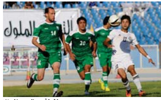
لقطة من دوري الممتاز

المصافي في ملعب الأول. وفرت لجنة المسابقات إقامة مباريات الجولة الخامسة لفي السابعة للتعامل ضمن الجهاض الفني للفريق من جهة أخرى رسمت الهيئة الأثرية الساري أربيل اللاعب صالح سبيح أنه أن ارتدى قميص نادي أربيل في موسم عمدة أفريقيها الكروي الذي يقوده الحرب أيوب أويشيو.