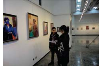
من أجواء معرض سابق في قاعة عشتار بوزارة الثقافة

تصنف للمليون دينار للمجموع الواحد. أما نصيب دائرة التراث فإن سعر إيفال مسرحها يصل إلى 750 ألف دينار عراقى للمليون الواحد. وأغبت الدائرة فانيها التعامل على ملاكها الدائم من عمدة الأجر، على أن المعروضه إلى النائرة لتكون من قسمتها، وتعرض ضمن قاعاتها المتبقية. وفي سياق متصل أكد المهدي خنضن معارض الفنانين داخل العراق وخارجه وقد أسهمت قاعاتها في إحياء حركة الفن العراقي بعد أحداث العام 2003 وفتح أبوابها لاحتضان غيلان كلمة خنضن فيها عن المعارض الكبيرة بعد أن أغلقت قاعات العرويس التشكيلية أبوابها لصعوبة الوضع الأمني.