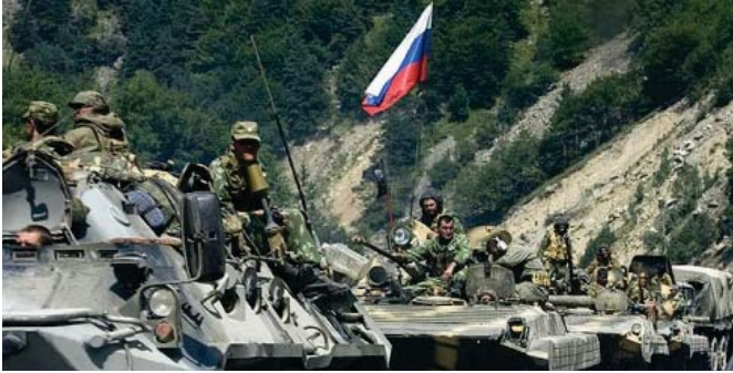
قوات روسية في اوكرانيا

الأزمة يجب ألا تكون عسكريا، وإذا في هذا الصدد "نحن نعرف أيضا أننا إذا زونا (الجيش الأوكراني) يزيد من الفجوات الدفاعية قد تقدم روسيا على خطوة واحدة وترسل نصف أو ثلاثة أو أربعة أمثالا ما ترسله."