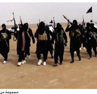
مجموعة من عصابات داعش "رشيف"

بغداد - الصباح الجديد: اعلن وزير حقوق الانسان محمد مهدي البياتي ان القضاء على عصابات داعش في الوقت الحاضر يحتاج الى تضامن ودعم دولي كتحسين هذه العصابات وخولت من تفويض العمليات والعمليات المتناسقة الى مرحلة التعاون والوقوف في سوريا والعراق ولديها مصيرف تنوع اموالها فيه من خلال بيع النفط ورفض الضرائب على المواطنين وعرض النجدة والثاني ايفاح منظورة تضلها من جهات داعمة. واوضح وزير الخلال لقائه نائب وزير الخارجية الاميركية تشييه كروكر والسفير الاميركي الدائم لدى الامم المتحدة كيث هاربر والوفد المرافق له بحضور رئيس بعثة جمهورية العراق في مجلس حقوق الانسان