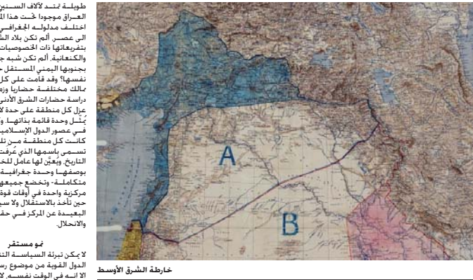
خارطة الشرق الأوسط