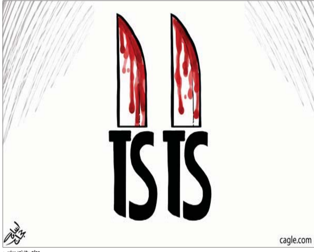
موقع «كارتون سياسي»