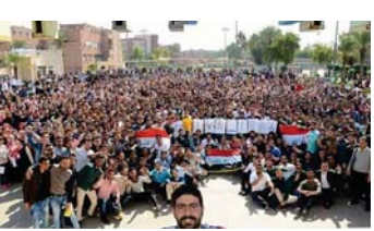
"سيلفي" طلاب الجامعة التكنولوجية ويعني Victor أي المنتصر كما رسمت علامة السلام داخل حرف O من كلمة العراق بالاجنية في رسالة سلام ومحبة إلى كل الشعب العراقي

بغداد - الصباح الجديد: كما وعدنا الشباب العراقيون على دعم جيشهم بطريقة لافتة وبترية ما هم ينظمون وقفة موحدة ترمز إلى الانسانية في وجه المعارك التي تعصف في البلاد. فقطال الجامعة التكنولوجية الواقعة في بغداد اخبروا أحد صحفيي الإعلام العراقية من قبلهم عن الممثل العراقي والفنانة الايتية والفنانة الشيعي واللافت على طريق السلفي لتكون أكبر صورة سيلفي جماعية في العالم. وتظهر على الباطنات التي حملها الطلاب حرف ال V في بداية كلمة Viva بالون الاصفر