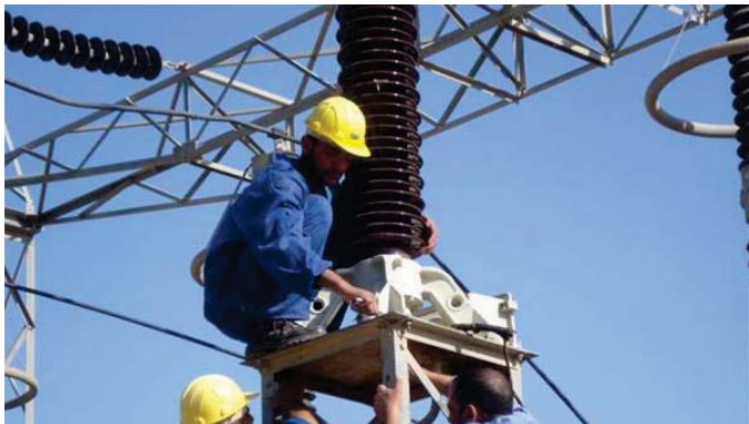
انشاء نصب المحولات "رشيف"

مبارق (174) حالة تجاوز نصب (171) مقياسا، في جانب صيانة المقياس العاطلة وارجاء الجاهية لـ (44) مشكرا، واستحصال الدين المتسقة من مشتركين احدثين. والتي باشرت الملاكات الهندسية كهرماء الوسط الهندس ابراهيم اسماعيل العبيدي حملات مكثفة لزالة التجاوزات على الشبكة الكهربائية. وبين المبرس ان الاعمال تضمنت نصب مابربس من (300) مقياس ملحقها الى جانب نصب وتوسيل (7657) عمودا من شتى انواعه ضمن قطاعات كهرماء الحلة