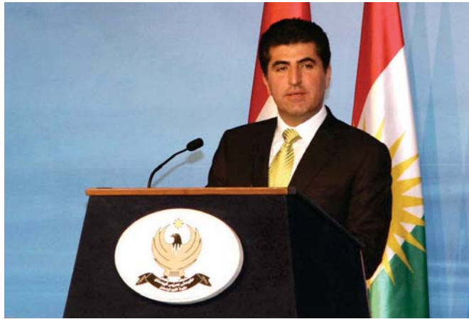
نجيرفان بارزاني "ارشيڤ"

اربييل - الصباح الجديد: قررت الحكومة الايطالية رفع مستوى تمثيلها الدبلوماسي في اقليم كردستان الى قنصلية عامة، فيما أكد رئيس وزراء الاقليم نجيرفان بارزاني ان ايطاليا مستمرة في تقديم الدعم الانساني والعسكري لاقليم كردستان مجدداً مؤكداً ان دعم حكومة الاقليم استفادوا من الترخيص فقاموا باحتضانهم واولادهم كاشفاً بعض النطر عن الاتهامات العراقية والبيدانية. وجاء ذلك بعد استقبال رئيس الوزراء الايطالي ماثيو رينزي رئيس القنصلان لرييس حكومة الاقليم نجيرفان بارزاني والوفد المرافق له واعرب نجيرفان خلال اللقاء عن شكر وتقدير شعب حكومة اقليم كردستان لما تقدمه ايطاليا من دعم انساني وعسكري له وقدم نبذة عن الأوضاع في الاقليم والتطورات والتقدم المستمر الذي احرزته قوات البيشمركة، فضلاً عن الحديث عن اوضاع اللاجئين والنازحين الذين يشكلون عبئاً ثقالاً على كامل حكومة الاقليم وواجبهم الى المساعدات والعونات بشكل أفضل.