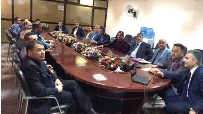
جانب من اجتماع سابق لأحد القادة