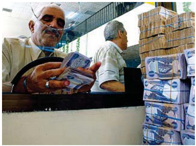
تعاملات مصرفية بومية