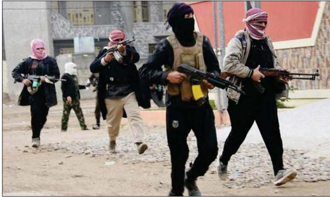
عناصر داعش في الموصل "ارثيفي"

غارات جوية متتالية استهدفت مواقع التنظيم في قضاء سنجار وايضا قرب منطقة اسكي موصل (غرب) موقعة خسائر فادحة بالتنظيم، فيما استهدفت غارات اخرى رتلا كبيرا للتنظيم في مناطق تاتخامة لمنطقة الكوير (جنوب شرق) اسفرت عن تدمير العديد من الايات ومقتل واصابة العشرات من عناصره