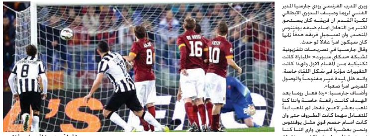
لغظة في مباراة روما ويوفنتوس

وتسجيل هدفًا ثانيًا كان سيكون أكثر مأساة من الهزيمة على ريفالو