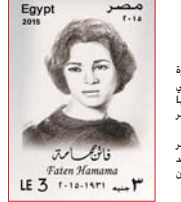
مصر 2015 Fatem Hamama 3 10-19-1931 LE

المصر - د ب أ: اكتشف تقريز إيجري في نيوزيلندا أمس آلاف من العثور على رفات بشرية قرب نهر جليسي من المرجح أنها لتبنايت فقد في المنطقة منذ 42 عاماً تقريباً. وكثرت صحفية «إن زد نيوز» في 17 يناير عن العثور على سحج نهر تاسمان الجليدي ومتملق.