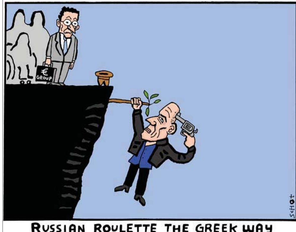
موقع «كارتون سياسي»