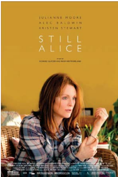
الملصق الدعائي للفيلم

تعب عن ناطرها كما أن المشاهد الأخرى لتفيلم صورت بمساحات قصيرة الأوزان الأفعال الملوثة الغلبة وذلك النحار الصارخ بين التت الصغرى لبيدا والام واخب جعلها خديا للمساءة وانتصارا سلاح الحب. فيلم "Still Alice" تمثيل: جوليان مون، اليك بالدوين، ريتشارد جليتز، واش ويستموريلاند