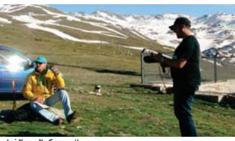
جانب من كواليس الفيلم

بغداد - الصباح الجديد: حاز الفيلم العراقي «كوميديا جادة» على تسمية مهرجان «ليبو» السينمائي الدولي بحسب ما أعلنت لجنة تحكيم المهرجان في دورته الخامسة عشرة التي أقيمت فعالياتها في سانتياغو عاصمة تشيلي. وقال بيان صادر من لجنة تحكيم المهرجان: «حصلت «الصباح الجديد» على نسخة منه من 1600 فيلم من شتى دول العالم. نافست على الجائزة وفهم هذه الأفلام منحنون وصناع أفلام وكتاب ومخرجون ممتازون والكفاءة والهيبة العالمية والقدرة على التحليل ما سمح لنا بأن نشير بانتطال موجة عالمية جديدة من الأفلام التي تستعمل مع بقية أدوات الوضو الانساني على خستن وجه العالم الأرقع بالوق السينمائي».