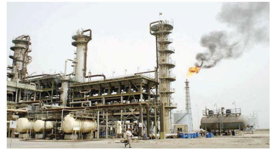
منشأة نفطية جنوبية "رشيف"

بالتحرج والنمو بسبب زيادة طلب المواطنين للحصول على خدمات عامة أفضل والحفاظ على أسعار الاحتياجات الأساسية والمنتجات الضرورية المستوردة المنخفضة ومع كفاك السلطة الحاكمة للحفاظ على فواتها السياسية، فإن حجم "الكثرة اللحية" سيكبر بنحو مستمر مع الزيادة "الرائدة" المتناهضة خسين مستويات النفقة بما يؤدي إلى الختمات العامة الرجيمة وزيادة الدخل والأسهات، ولكن من الزيادة لآلية والإنتاج المحلي وفي الإنتاجية وفي الاستثمار في الصناعات غير النفطية، ولذلك ما لم يتحكم الحكومة بطريقة منتظمة في التغيرات المتصلة لسلكو لتغيرات الاقتصادية الكلية، فإن هذه الختات الاقتصادية الكلية على تخصيص الاستثمارات أكثر من أجل زيادة الصادرات (الإيرادات) النفطية وبعض النظم إن تآكل هذا المورد الطبيعي ذي القيمة، وبالتالي زيادة اعتماد الاقتصاد على الإيرادات النفطية وزيادة النفقة التي هي التي تؤدي إلى الإفراط في الملتج وهي التي تؤدي في النهاية إلى المعايير المتنامية للعمليات الاقتصادية الكلية والتي تنهتج بتعميق المشاكل الاقتصادية الهيكلية.