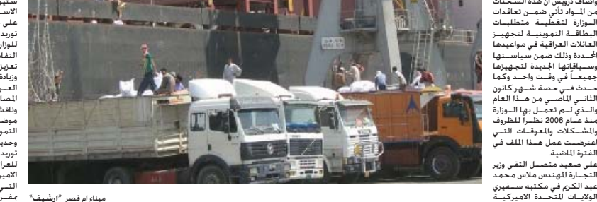
ميناء ام قصر "ارشييف"

استوارت جونز وجمهورية ايران الاسلامية حسن دنائي كلا على حدة للتباحث في البيات توريد مفرات الحصة التموينية للوزارة اضافة الى الموضوعات ذات الصلة المشتركة التي تخص تعزيز وتطوير العلاقات التجارية وزيارة حجم التبادل التجاري بين العراق وثلك البلدان ما يخدم المصالح المشتركة.