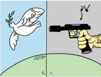
احد اعمال الفنان

بعدم مرور السلام من هنا. تذكر ان الدليمي مولود بغداد 1963، كالكوريوس كلية الفنون