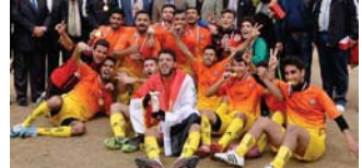
قسم العلوم التطبيقية يتوج بالكناس