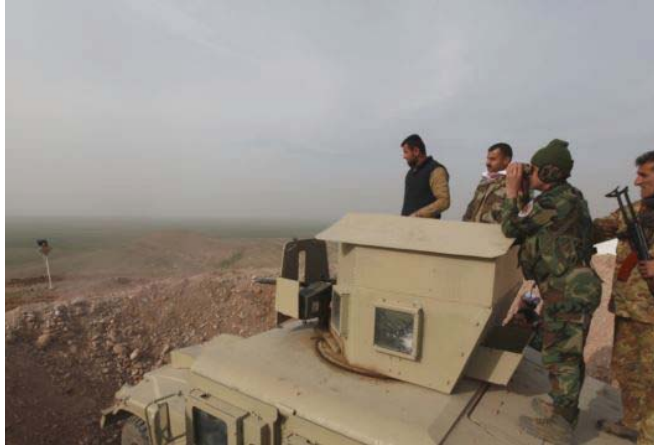
مجموعة من البيشمركة "ارشييف"