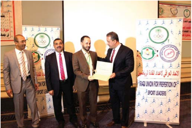
جانب من توزيع الشهادات في حفل الختام

وشهد حفل الختام توزيع شهادات المشاركة والقرارات الكلمات من قبل المشاركين الذين اقاموا على خطط الاداء الخاصة في اقامة الدورات والتدورات ورش العمل داخل العراق وخارجها بقيادة اعداد قادة قادرين على النهوض بواقع الرياضة العراقية التي تحتاج الى تشجيعه وفوانير خسر الادية. مطابرين في الوقت نفسه الحكومة ووزارة الشباب والرياضة الاسراع في ايجاد الية لتمليك الاراض حنى تتمكن الادية من ادارة شؤونها