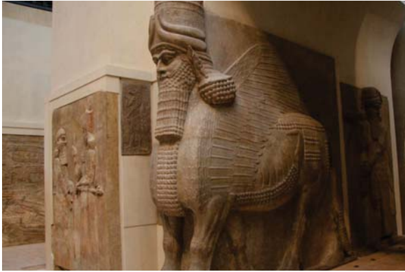
تدمير الآثار في العراق. كارثة ثقافية كبيرة

ثمة وسيلتان للمعالجة بالحقوق، أو التعبير عن موقف، أولهما الوسيلة السلمية المتمثلة بسلك الوسائل الدستورية التي كفلتها القوانين والأظمة. وفي حالة عدم جدواها هناك الوسيلة الثورية، وهذه تشمل غالباً في المظاهرات والنزول إلى الشارع، مؤخرًا، ظهرت وسيلة أخرى تتمثل بالفتيسر بول. فر استغلالها من قبل بعض الشرائع والطقرات التي لا تملك رصداً شعبيًا، ولا قوة تأثير، ولا آفة حرة بأهل الفصح، أو رعا، فإنها لا تملك إرادة التغيير، فقشرت الجحوة إلى الوسيلة الأخيرة بوصفها الأقل تكلفه. ما حدث قسب أيام من كارثة ثقافية كبيرة حدثت على العراق وهي تدمير أثاره التاريخية في مدينة الموصل والنموذ بدل على أن هناك جهات دولية وإقليمية وإقليمية تقود مؤامرة كبيرة لتجريد العراق من كونه الأثرية والتاريخية، خصوصاً وأن بعضاً من تلك الدول تتحسس على حجرة من الأحجار التي تكسرت تحت معاول داعش، ما يهنا هو موقف المثقف العراقي، بوصفه الوريث لتلك الحضارة والامتداد الطبيعي لها، هذا الموقف كان حرجولاً منردداً، فهو استنقل الأثر الفراع، بغليل من الانفعال، وبثيرة أكثر حسنة، ردة فعله. اقتصر على عدة أمور، وكلها غير موقع التواصل الاجتماعي، طبعاً فقد قام بعض المثقفين بتعبير صوره الشخصية بعرض في المتاحف دائماً هي أعمال أصلية أم تقليد مضمود، والتي لا يستحقها البلد، والتدخل بعرضهم يعرف، هل عاداً لا تعرض الأصول وحصر عليها من الضر، وإن ما يعرض هو تقليد مضمود جداً. فالورد عليه أحجمه بأن العروض في متاحف الدول التعانئة على حد تعبيره، وخصوصاً الثقافية، فسوف يتراح بأنه وطنين على العني هو بولاً وأخيراً أحد