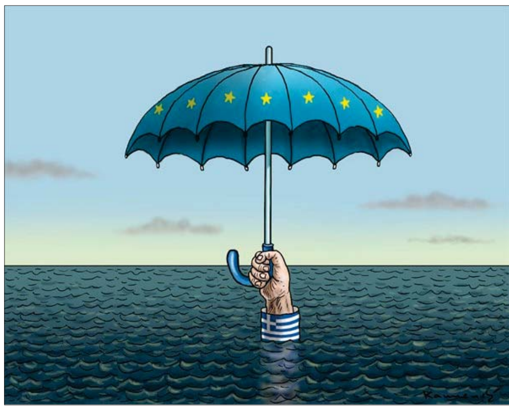
موقع «كارتون سياسي»