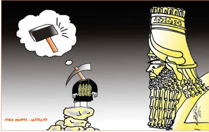
كاريكاتير . عاصم جهاد