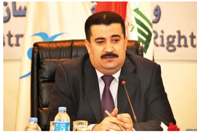
محمد شياع السوداني "ارشييف"

ان القرار يشمل الموظفين في جميع المؤسسات الحكومية والوزارات اذ وجهت الوزارة من خلال الوزارة من خلال القرار المذكور بتشخيص الزوراء كافة لموظفيها من المتجاوزين على الحماية الاجتماعية واتخاذ الاجراءات القانونية بحقهم من قبل وزارتهم