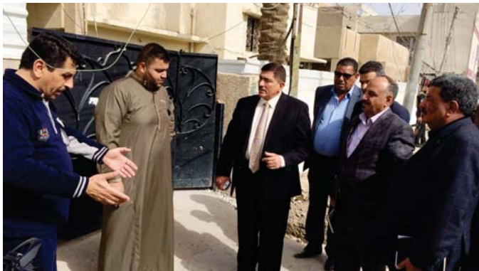
مدير عام كهرباء الكرخ يستمع الى مقترحات عدد من المواطنين

نشر وترسيخ ثقافة الترشيد من خلال زيارات ميدانية يقوم بها فريق اعلامي متخصص الى طلبة المدارس تضمن اقامة وسامرات خذ الطلبة الى اتباع اساليب الترشيد وتوزيع ارباب ابراهيم على اتباع ذلك. اضافة الى عقد ندوات توعوية وبالتنسيق مع المجلس اقلية وتوعيت مؤسسات المجتمع المدني واقامة المعارض والمصور والشعارات والبوسترات التي تحمل شعارات الترشيد والحماية.