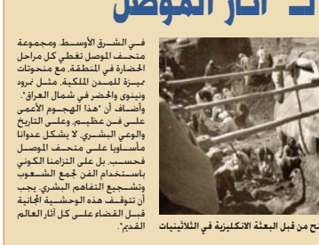
صورة نازرة لاكتشاف الثور الجف من قبل البعثة الانكليزية في الثلاثينيات النبوي