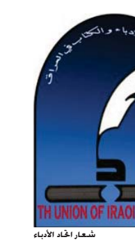
شعار اتحاد الأدباء

آخر يقول: تدمير المتحف اليوم كان لسبب عفاندي كما هو واضح النص قرأني أجدت داعش تطيقه بعد أن أماته البدعة طوال قرون! هكذا تساح من المثقفين، رما فرحوا بهذا الفعل على اعتبار أنه بدعم أراهم في الدين وهو فرصة عظيمة لتثوير الناس ضد الدين، لأن داعش هي الوجهة الحقيقية له. لأن تخليص التماثيل والآثار من مسموم الاستسلام، وإن بدعة التي ظهرت هي التي المغتسل من التخليص من تلك التماثيل متفق آخر نشر "بوستا" يقول فيه: حسبت عاصم الأديان بأن الديانات الوثنية كانت مثلاً للمعاصرة الوطنية، والوجهة العاكس للديانات الجديدة! للسنا هنا في معرض الدفاع عن الدين ولكن ما هو موقف المجتمع من المثقفين الذين يترفع ضد ذلك الجمهور وهو يلتصق بعقيدته العنقيدية من وجهة نظر هذا المثقف، تدعم للسلخ والسلخ، وحقن التعمو والسرفة والنهب؛ المثقف الحقيقي الذي يعيش موم مجتمعه، ويتفاعل مع الحن التي تعرض لها عليه، أن يكون جزءاً من ذلك المجتمع، لأن يترفع عن الثقافة لا تعني أن يكون المثقف بين وعقيدته مجتمعه، حتى لو كانت تلك العقيدية رسالة الأخلاقية مزلم حسب باحثه فهو أن يفصح عن مجتمعه في توره وإرتاده في الطريق الصحيح. على المثقف العراقي أن يخرج إلى الشارع وأن يستنكر أفعال داعش بحق التراث والآثار العراقية، وأن يشعر المجتمع بالحرص على حضارة بلده، لأن يكتفي ببوستات وصور وضعت رغباً عنه، وكأنها عطلت نشر قصائده وصوره ومشاركه التي ترملة بعنائه التعاليقات والأجاليات بما يكفي لاشباع وترجيسته وأناه، عليه أن يقول مجتمعه: "أنا مموها".