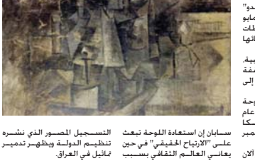
سبايان ان استعادة اللوحة نعت على الأبراج الحقيقي في حين يعانى العالم الثقافي بمسبب