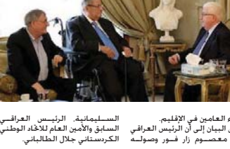
المندوب العامين في الاقليم، السيد طه جباري، ورئيس الجمهورية فؤاد معصوم

اربييل - الصباح الجديد: وصل رئيس الجمهورية فؤاد معصوم الى مدينة السليمانية صباح امس السبت. والنفي فور وصوله بالأمين العام للاخاء الوطني الكردستاني. وأشار بيان صادر عن رئاسة معصوم وصل الى مطر السليمانية الدولي حيث كان في استقباله اقليم حكومة اقليم كردستان قيود الطالبياتي وكبار قيادات الاحاد السليمانية اسنو فريدون ورئيس مجلس محافظة السليمانية هنال والشعبية لانهاء هذا الملف أبو بكر وعدد اخر من المسؤولين