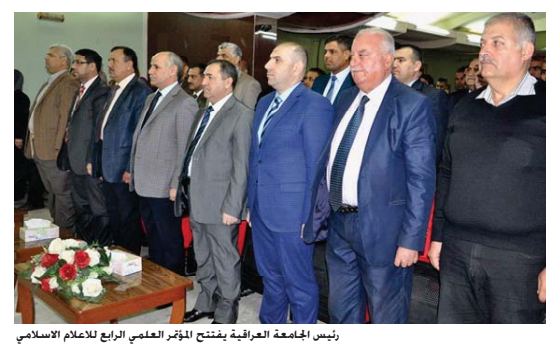
رئيس الجامعة العراقية يفتتح المؤتمر العلمي الرابع للاعلام الاسلامي

العراق بنحاح التي مثل هذه المؤتمرات العلمية لكي تتناول الجوانب العمومية والاسلامية بخصوص خاص لما في ذلك من فوائد في مضمونها البحثي