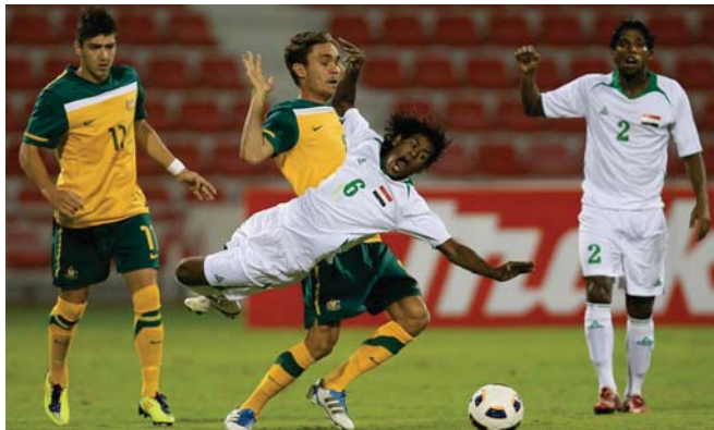
لقطة أرشيفية للمنتخب الأولمبي أمام أستراليا "عمسة" فحطان سليم

على موافقته قبل إعطاء الموافقة النهائية للمنتخب الشيفقة.. جاسب منضمات سلطنته عمان والسعودية والأمارات تقدمت بطليات رسمية من أجل ملاقة المنتخب الأولمبي العراقي.. لاقتا إلى أن "الأخاء العراقي فأخ المبر مبارك جزيرية المنتخب الأولمبي جيسى علوان من أجل الحصول