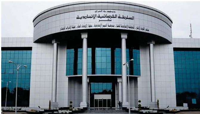
واجهة مبنى مجلس القضاء الأعلى "الرشيد"