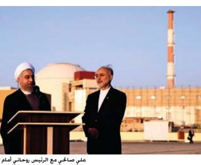
علي صالحى مع الرئيس روحاني أمام أحد المنشآت النووية في إيران

علينا التطرق إلى التفاصيل وتبدأ بضمين الاتفاق النهائي الأطراف العام والتفاصيل. وتطلب الدول الكبرى إيران بأخذ من قدراتها النووية يגיע معها من التمكن يوماً من اقتناء الأسلحة الذرية. أما طهران فترفض من جانبها بحقها في الطاقة النووية المدنية الاقتصادية الغربية. وهذه المفاوضات التي انطلقت في تشرين الثاني 2013 ثم عيدها مرتين. وقد أظهر تقرير الأمم المتحدة أن إيران لم توسع نطاق اختبار إنتاج أكثر النصب. من أجهزة الطرد المركزي التي تستخدم لتخصيب اليورانيوم وذلك في إطار اتفاق نووي مع القوى العالمية الست. وتضمن اتفاق مؤقت من 2013 في إيران والدول الست. على أن يوسع طهران مواصلة مفاوضاتها الحالية في أبحاث وتطوير التخصيب. في إشارة إلى أنه لا ينبغي التهافت من المفاوضات.