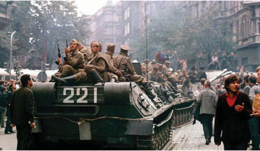
الغزو السوفيتي لدولة تشيكوسلوفاكيا "ارشيف"

من جانبه . كان مركز قيادة KGB مفتنعا بان الوقت باتل من ان يتم هدرة وكان التركيز يعنقد ان امين إما "سليعب لعبة السنساتين ويطرد البشتشارين السوفيتين يجرى ان مسح قويا ما يكفي كي يتحول قادة الولايات المتحدة " من جانيه ايرد مقرر KGB في كابل عن شقيق امين عمده الله انه قال لجديده "من الواضح منطقيا بالنسبة لنا ان نتبع خطى مصرع ونعامل مع الروس كما تعامل معهم الرئيس السادات " في عصرهم الرئيس امين