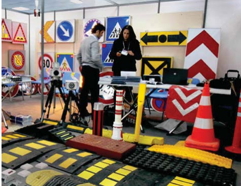
أحد أقسام المعرض

جدا باستضافة كركوك لهذا المعرض للمرة الثانية لأنه عكس صورة واقعية عن التنسج الاجتماعي المتراسب في مدينة كركوك.