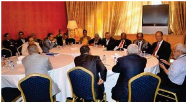
الوفد الأممي خلال اجتماعاته مع الأطراف اليمنية

بعد إعلان الوسيط الأممي في اليمن جمال بن عمر الجمعة توافق الأطراف اليمنية على تشكيل المجلس الرئاسي. وقال بن عمر إن القوى السياسية اتفقت على تشكيل مجلس انتقالي للبحث في مشاركة جميع الأحزاب في العملية. وقال بن عمر هذا التزم لا بعد اتفاقاً لكنه اختار مهج يهد الطرح نحو الاتفاق الشامل. ولا يزال مطروحا على طائلة الحوار فضاء أخرى يجب حلها تتعلق بوضع مؤسسة الرئاسة والحكومة فضلاً عن الضمانات السياسية والأمنية اللازمة لتنفيذ الاتفاق وفق خطة زمنية محددة. وإن يعلن الاتفاق النام إلى بالتوافق على كل هذه القضايا. وتأتي هذه الخطوة في أعقاب استيلاء الحوثيين على السلطة. وإصابة الكثير من مؤسسات الدولة بالشلل. يذكر أن لجنة جنوية أعلنت أن القوى السياسية اتفقت على تشكيل مجلس رئاسي مؤقت من 12 عضواً. وصرح أحد مستشاري الرئيس اليمني المستقيل عمرهيو معمر هادي إن غداً يوم أمس السبت يوم إقامته الخاص من قبل الحوثيين في صنعاء لأول مرة منذ 4 داهم الحوثيين التزل في أواخر كانون الثاني ووضعه قيد الإقامة الجبرية.