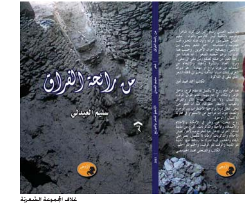
غلاف المجموعة الشعرية

منذ نشأتها، يقول الشاعر إنه ما أن توفي فيون الربيعي عام 809 ميلادية "على شرح واه في الأقتال" من رحمها الخضار... على شامباتك نزاح فرعون مع إنشاك، تقبل الأبنان فيك ولا تذلن". ولكن المعدل في الأراضي الفلسطينية لا تتوقف أمام صمته بعينها بل جعلت قصيدته عنوانا جاعا هو "فلسطين" ويشهد الجن إلى أرقه القدس وحيفا والخليل وسختر بعضا من أبرز شعرائها ومنهم محمود درويش وسميح القاسم وقدي طوقان. ومن المعشدة والعجب بقول: "عجب أن أنني لشعب أهمل تاريخه، واعتنق جغرافية المكان خدثني قدي عن أمهله، تقول: أعلم أن الفلسطينيين لتاريخها ولعجاب حضارتها تعاقبت عليها، حتى لو كان بعض آثار تلك الحضارة من صنع العذرة