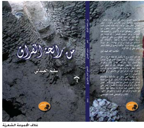
غلاف المجموعة الشعرية

في فوهه الجهد "من رائحة الفراق" يرخل الشاعر العراقي القسيم في الممارك سليم المعدل ورأه وألمه وأشواقه إلى الحرة والأمن فيكتب عن أحبها من ون أن تفراقه بغداد التي كان اسمها "مدينة السلام" حين جعلها أبو جعفر المنصور عاصمة للدولة العباسية عام 710 ميلادية، ففي كونهماجن التي "نماحت في الصفر" يجد الشاعر هذا الأمان ولكنه تحت وطأة شتاء يعقبه شتاء آخر يحول بين الشمس والمدينة لا يجد مغرا من وصف المدينة قائلا "سليتي هذه المدينة حرة التنفس- بعد أن أغوتني بالأمان". وفي تاج محل الذي بناه الإمبراطور المغولي شاه جهان بمعنى "ملك الدنيا" صرحا لزوجته تاج محل يجد الشاعر نفسه وسط زحام من القادسي