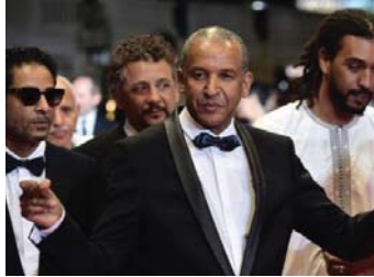
عبد الرحمن سيساكو

كان في منافسة مع فيلم "سان منحت جائزة "سيزار" الفرنسية لأفضل فيلم إلى "مكتنو" الذي بروي واقع الحياة في شمال مالي تحت سيطرة الجماعات الجهادية بينما حصد مسرح الفيلم الموريتاني عبد الرحمن سيساكو جائزة أفضل مخرج القيلم الذي حصد سبع من جوائز سيزار والرشح لجائزة الأوسكار الأمريكية في فئة الأفلام الأجنبية قصة اجتياح المسلحين الإسلاميين للظرفين لهذه المدينة التاريخية في مالي لفرض قوانينهم الصارمة عليها.