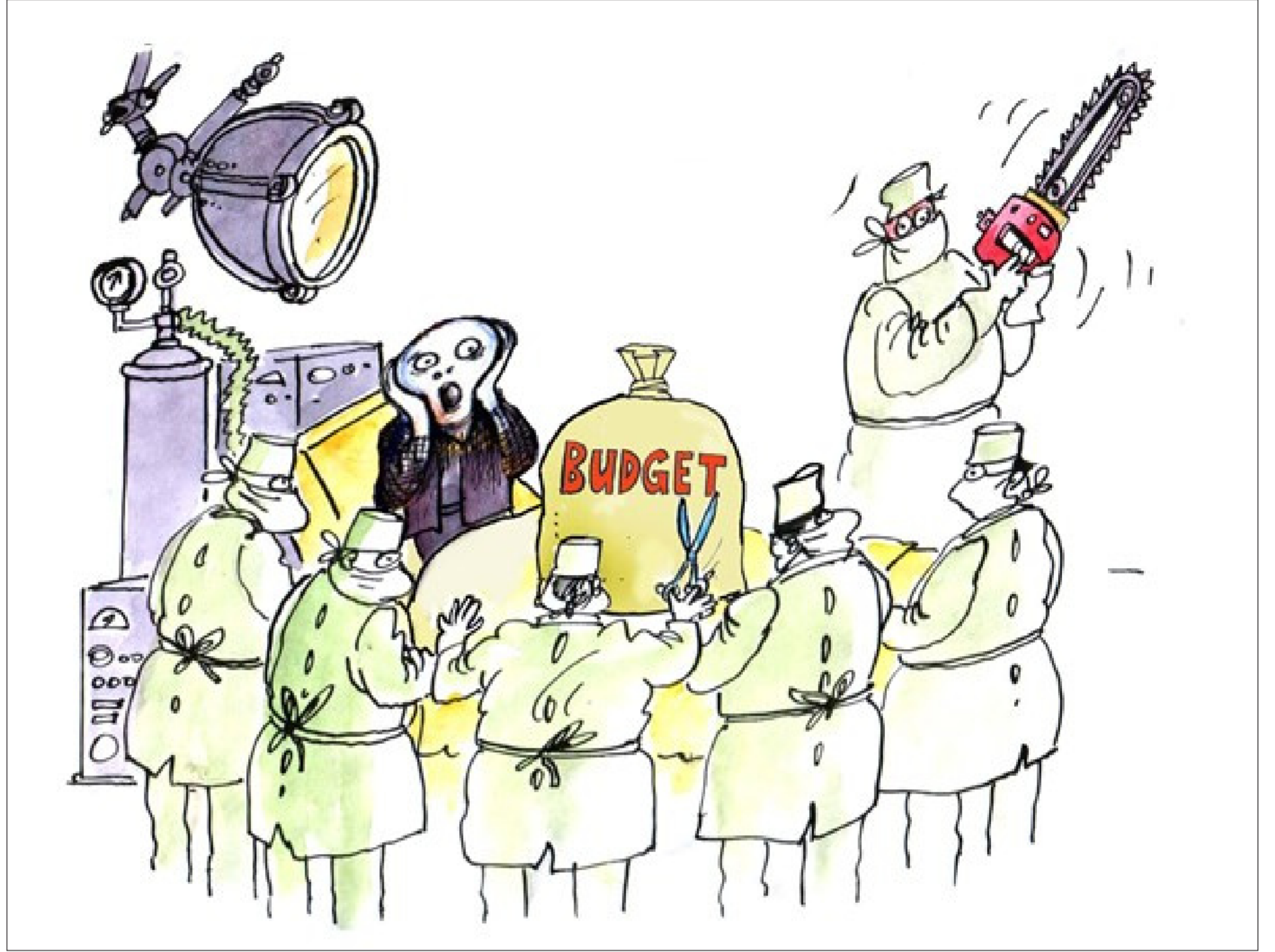
موقع «كارتون سياسي»