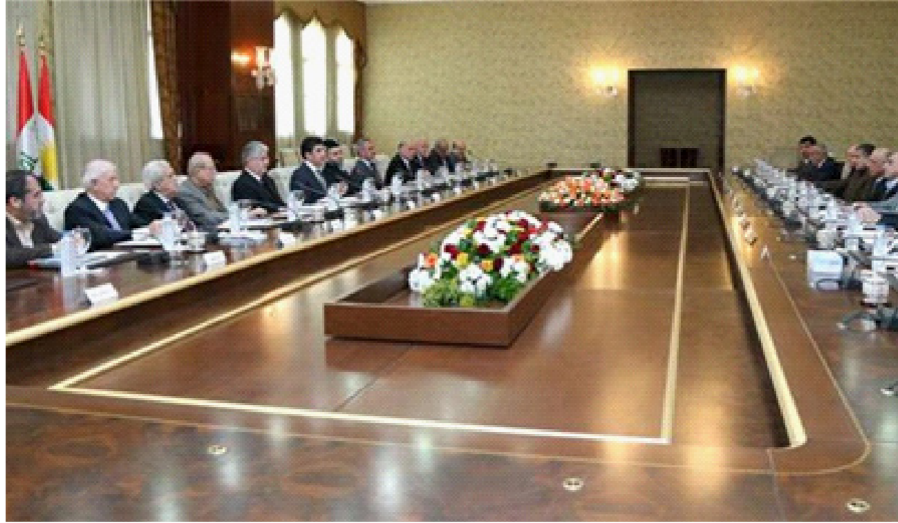
احد اجتماعات رئاسة مجلس وزراء الإقليم