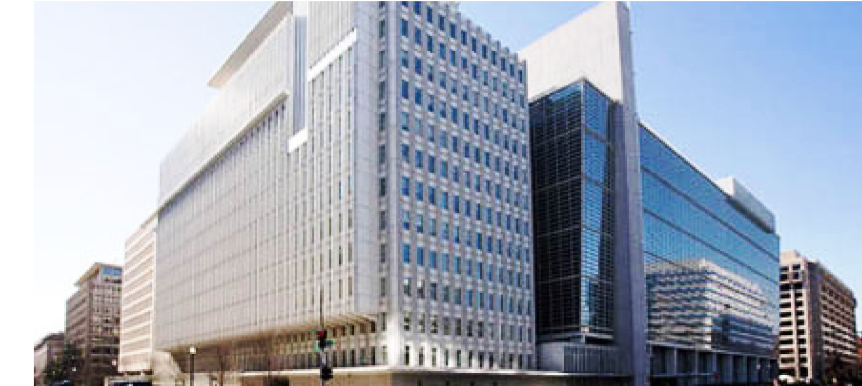
صندوق النقد الدولي

وفي 1959/7/8 صدرت العملة العراقية التي تحمل شعار الجمهورية، بعد سقوط الملكية في ثورة 14 تموز 1958، ولكن في الوقت نفسه استمر التعامل بالعملة