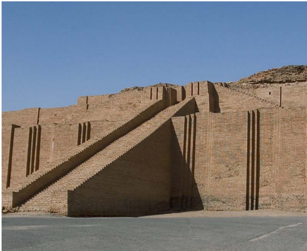
زقورة أور - محافظة ذي قار

الحيوانات عن التوالد ويتوقف الزرع عن النمو . ولا تنتهي الحكاية إلا بعودة ديموزي المشروطة إلى الحياة بعد ان يضع في عالم الاموات بديلاً عنه . ليحل بعودته الربيع والخصب والبركة في البلاد .