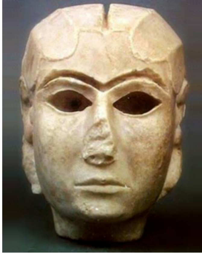
قناع أوروك - الوركاء 3100ق - م

وها هي إينانا - في أحد النصوص - تترث عريسها الذي سلمته إلى شياطين العالم السفلي « كم بكت بمرارة ... عريسها الذي من اجله . صيبا المدينة لم يقتلن شعورهن / عريسها الذي من اجله . شياطين المدينة لم يضربوا على صدورهم » . ويمكن الانتباه بيسر إلى ان طريقة الحزن هذه ما تزال هي نفسها في العراق اليوم . ويفسر قاسم الشواف في كتابه « ديوان الأساطير » نصاً ثانياً آخرورد على لسان إينانا . من ان غايتها لم تكن بكاء الحبيب الذي فارقته فحسب . بل كانت غايتها السعي لضمان استمرار حياة ديموزي بعد الموت . مما يهيئ لقبول الفكرة الرمزية عن عودته إلى الحياة ثانية . تلك العودة التي يصاحبها حلول الربيع والخصب بكل أنواعه ما يتطلب اقامة احتفالات الفرح وطقوس الزواج المقدس ابتهاجاً بالعودة . ولعل اختيار الانثى كإلهة . يعكس