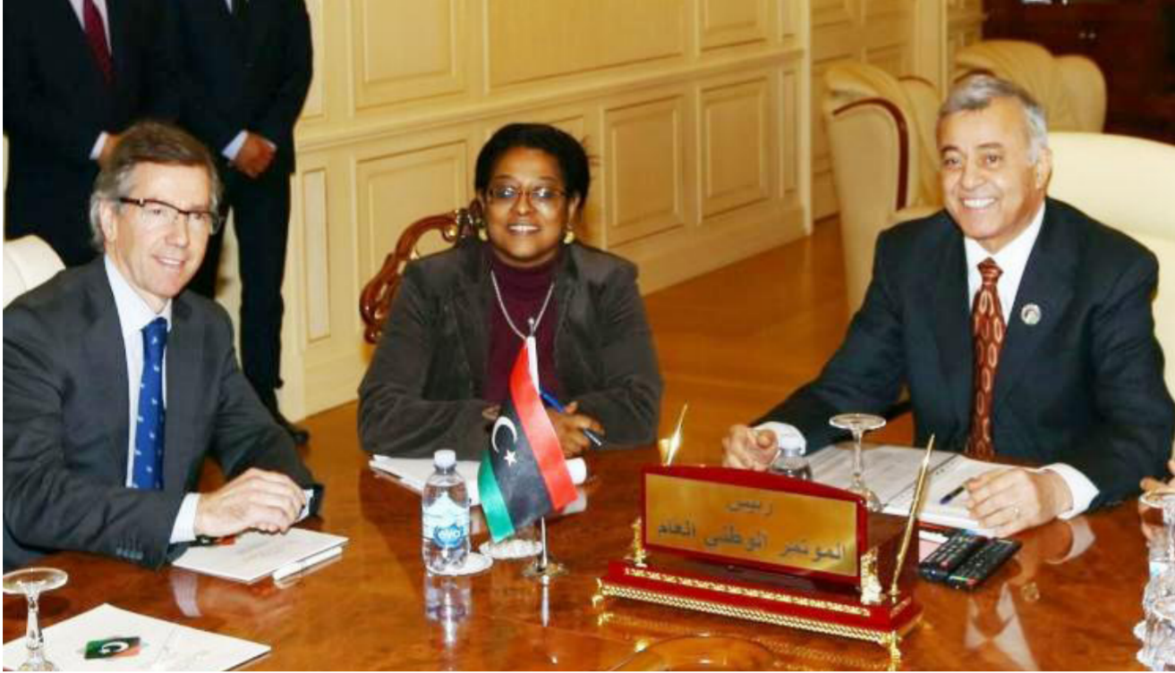
نوري أبو سهمين رئيس المؤتمر الوطني العام خلال اللقاء مع المبعوث الأممي في ليبيا

يتم التصريح به للإعلام إلى حين استكمال الإجراءات الأمنية وتوفير الظروف اللوجستية من أجل احتضان جلسات الحوار، التي أكد المبعوث الأممي للصحفيين أنها ستنتقل خلال أيام. ومنذ منتصف كانون الثاني الماضي استضافت الأمم المتحدة في مقرها بجنيف جولتين من الحوار بهدف الوصول إلى حل للأزمة الليبية، بينما أعلن المؤتمر الوطني العام تعليق مشاركته فيها.