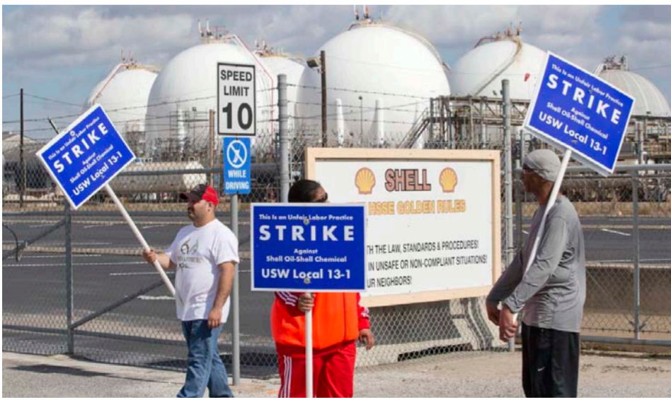
عمال نفط أميركيون يتظاهرون أمام موقع نفطي

أعلن مسؤولون نقابات عمالية أميركية الدخول في إضراب كبير في تسع مصافي نفط أميركية، بعد الفشل في التوصل لاتفاق مع كبرى الشركات العاملة في قطاع النفط الأميركي. ويمثل هذا أول إضراب يشهده قطاع النفط الأميركي في جميع أنحاء البلاد منذ عام 1980. ويطالب منظمات تمثل مجموعة أكثر من 10 في المئة من قدرة مصافي النفط الأميركية. وكان اتحاد عمال الصلب النحدين قد بدأ الإضراب منذ الأحد وذلك لعدم التوصل لاتفاق بعد انتهاء عقود العمال الحالية، ورغم وجود خمسة مقترحات لإنهاء الأزمة، فيما اشار الاتحاد بأنه لا خيار لديه. وقال نائب الرئيس الدولي بالإتحاد نوم كونواي في بيان له: «هذه الصناعة هي الأغنى في العالم ويمكنها المساعدة في إنجاز التغييرات التي عرضناها في المساومة التي طلبناها». وأوضح أن المشكلة تكمن في أن «شركات النفط جشعة جداً لإجراء تغييرات إيجابية في أماكن العمل، ومازالت