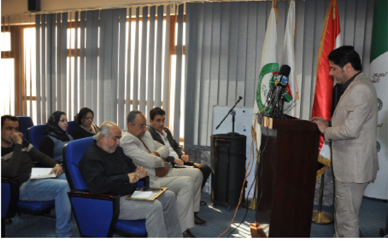
جانب من المؤتمر الصحفي لوزارة الشباب والرياضة أمس