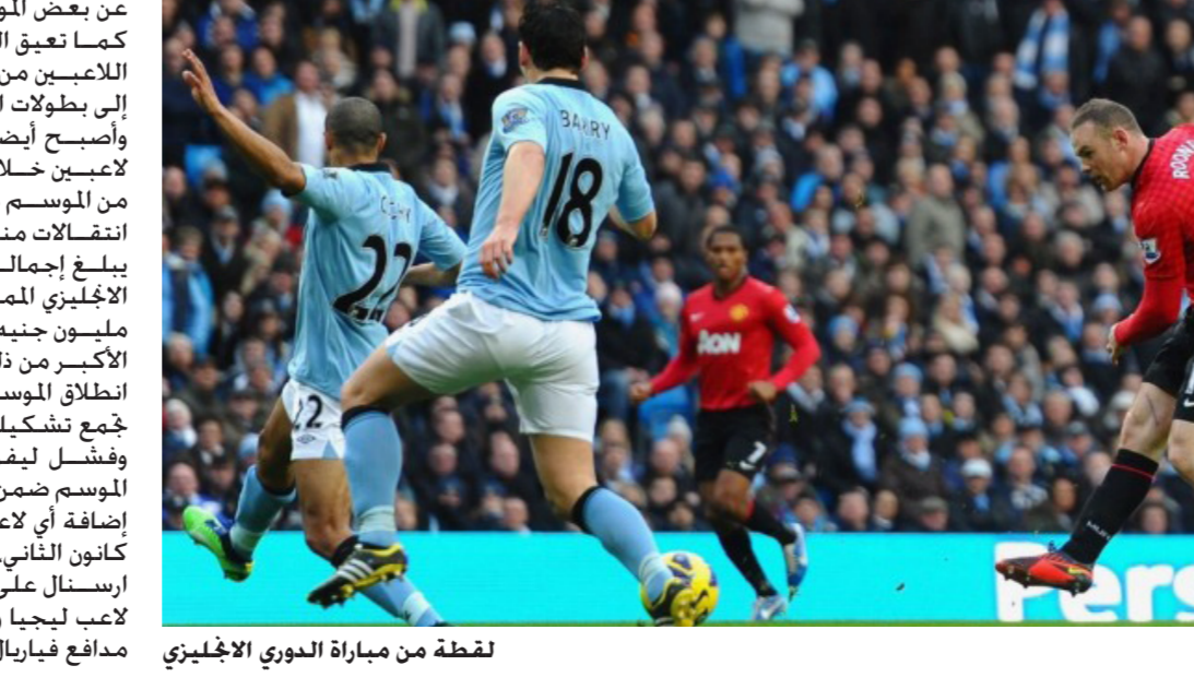
لقطة من مباراة الموري الإنجليزي