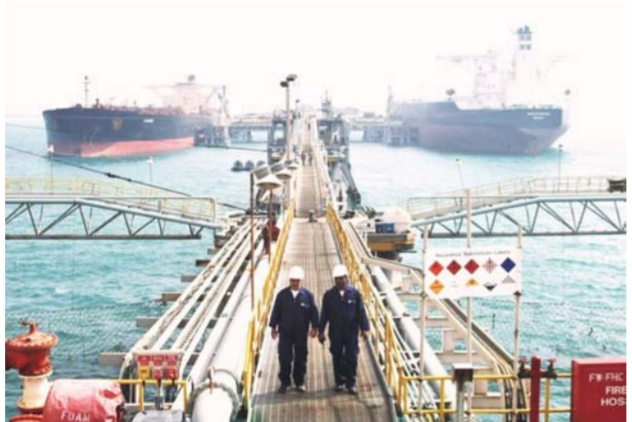
ميناء عامم لتصدير النفط في البصرة "ارشيف"

الحكومة يستعجل فيه اجراءات ارسال مشروع النفط والغاز". وقال النائب العبادي في تصريح الى "الصباح الجديد" إن "جهودها لتبنيها الحكومة لإرسال مشروع قانون النفط والغاز إلى مجلس النواب لغرض إقراره". مضيفاً أن ذلك يساهم في تسوية المشكلات النفطية بين المركز والأقاليم من جهة والمحافظة المنتجة للنفط والغاز من جهة ثانية". مؤكداً أن "القانون ينظم العلاقة النفطية بين جميع هذه الجهات وكذلك يمنع انتهاك قواعد التصدير".