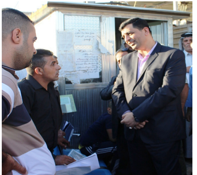
افتتاح مقر لجنة فحص السياقة والتعيين في المحمودية

للاس عكس المنطق . والاحساس بخطورة المرحلة . سيذهب القانون الى البرلمان ملبدا بالغيوم وملغوما بالفضائح . وسيكون عصيا عليه ان يخرج لنور قريبا . وسيأخذ وقتا طويلا مع التباينات والقرارات الاولى والثانية والعطل الرسمية والتشريعية وبذلك ستطول معاناتنا . وربما سنشهد مفاجآت في هذه الحرب القائمة في بلادنا . يكون عندها الحرس الوطني من افكار الماضي ! مع ذلك نقول.. ان امام مجلس الوزراء فرصة للثأر قليلا ومناقشة القانون مع رؤساء الكتل السياسية وإجازة جاهزا للتصويت . اختصارا للزمن وتخفيفا لاعداد الضحايا وارسال رسائل اطمئنان الى المواطنين وحلفائنا الاقرب والابعد . من اننا جادون في حربنا ضد الارهاب وتأمين السياح السياسي لها وتنفيذ احد اهم بنود ورقة الاتفاق السياسي والانطلاق الى مربع آخر ربما جد في داخله حلولا لازمانا المتوادة !!