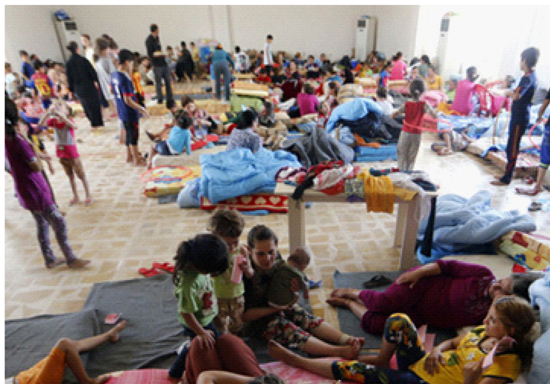
عائلات نازحة الى الاقليم