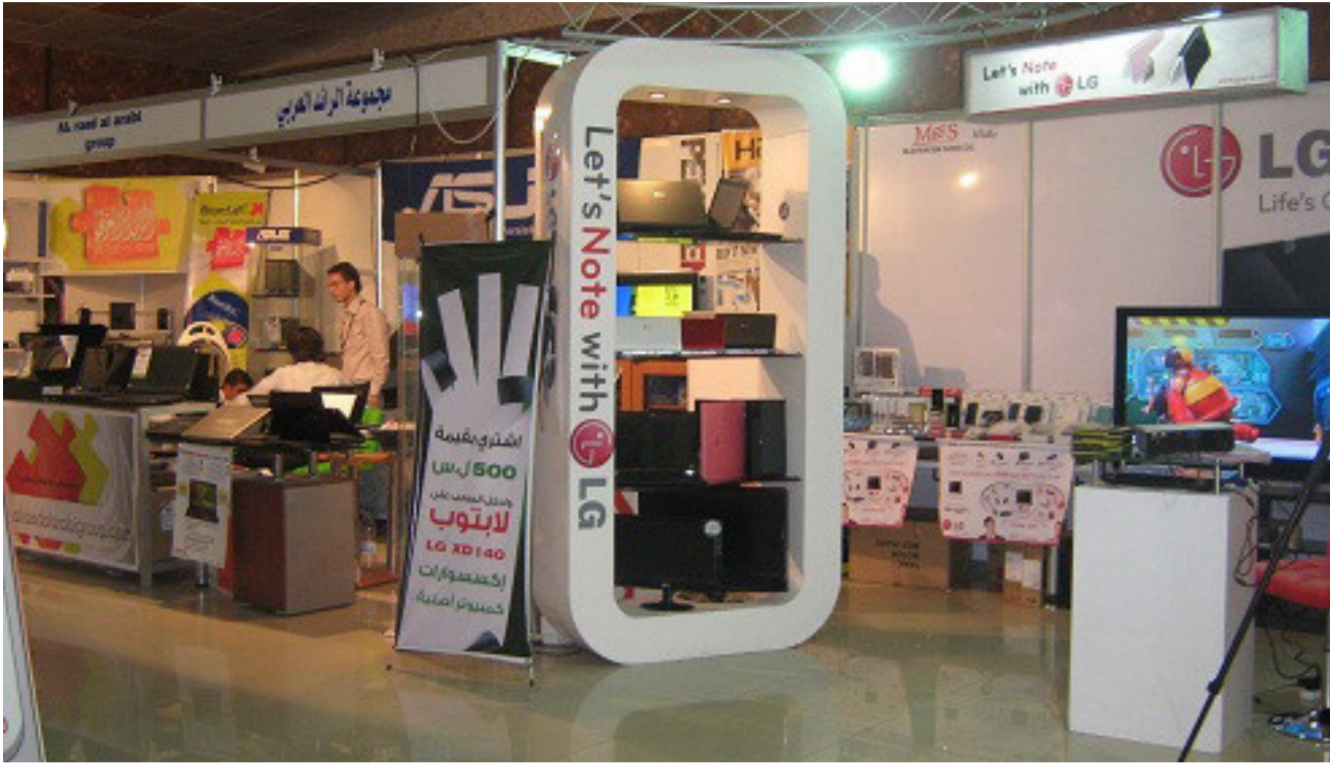
جانب من معرض كركوك الدولي الأول

كردستان وأعتقد أن الأوضاع الأمنية جيدة داخل مركز المدينة ومناسبة للاستثمار. ويرى مراقبون وخبراء اقتصاديون أن معرض كركوك الدولي هو باب جديد لنهضة اقتصادية عراقية، فيما يعد هذا المعرض هو ثاني معرض صناعي دولي يقام في كركوك بعد عام 2003.