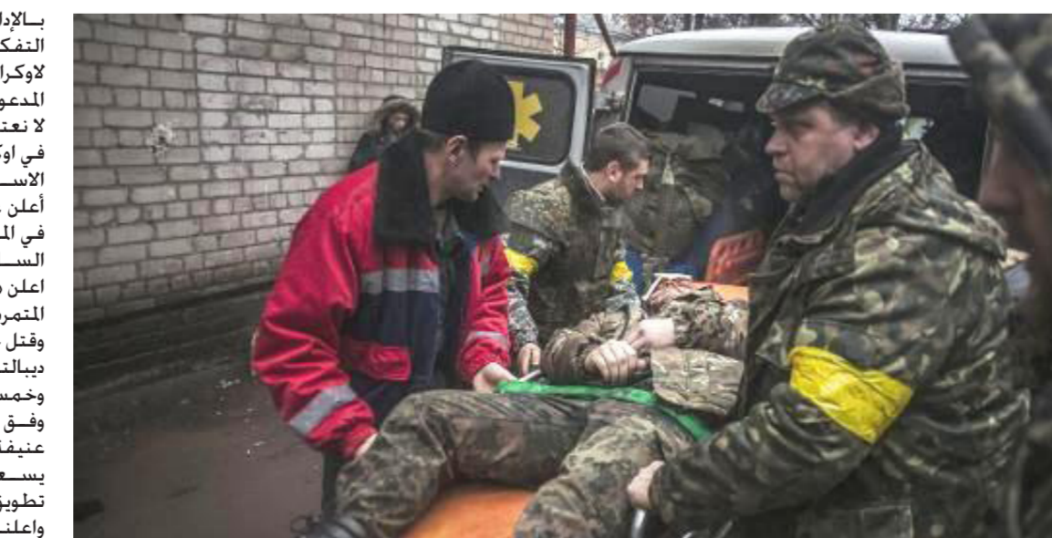
جنود اوكرانيون ينقلون جريحا خلال مواجهات مع انفصاليين في ارتميفسك في الثاني من شباط

بالإدارة الأميركية بأن واشنطن تعيد التفكير بشأن إمكانية تقديم أسلحة لأوكرانيا في القتال ضد الانفصاليين الموعومين من روسيا قال روس: «نحن لا نعتقد ان الرد المناسب على الأزمة في أوكرانيا هو ببساطة المزيد من الأسلحة». وعن الوضع الميداني فقد أعلن عن مقتل 16 مدنيا على الأقل في المعارك العنيفة بشرق أوكرانيا في الساعات الأربع والعشرين الماضية كما أعلن مسؤولون حكوميون وآخرون من المتمردين أمس الثلاثاء. وقتل خمسة مدنيين في محيط بلدة ديبالتسيف وستة قرب دونيتسك وخمسة في منطقة لوفانيسك المجاورة وفق المصادر، وتدر منذ أيام معارك عنيفة في محيط ديبالتسيف حيث يسعى المقاتلون المواليون لروسيا إلى تطويق القوات الأوكرانية. وأعلنت وزارة الداخلية في حكومة منطقة دونيتسك، عن مقتل خمسة مدنيين في ديبالتسيف، وأفادت الوزارة