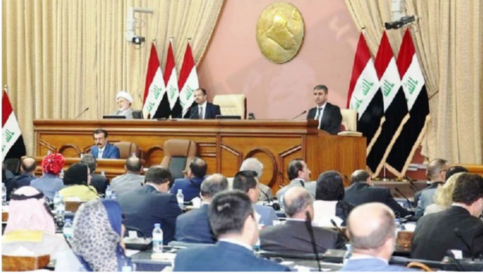
مجلس النواب "ارشيف"