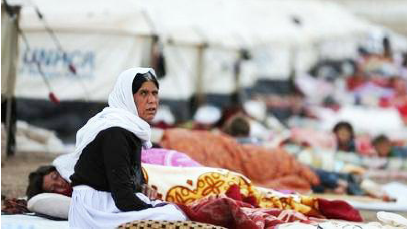
جانب من معاناة النازحين "ارشييف"

فرق عمل مشترك لزيارة الاسر النازحة ورفع مستوى الدعم المادي والعنوي بتقديم مساعدات جديدة لهم وتوفير مشاريع مهنية تتناسب مع المهن التي كانوا يمارسونها في مناطقهم الاصلية بغية الحصول على دخل مناسب . مشفيرا الى اعطاء اولوية للارامل وعائلات اليتام وذوي الاحتياجات الخاصة والعاطلين عن العمل عند توزيع المساعدات .