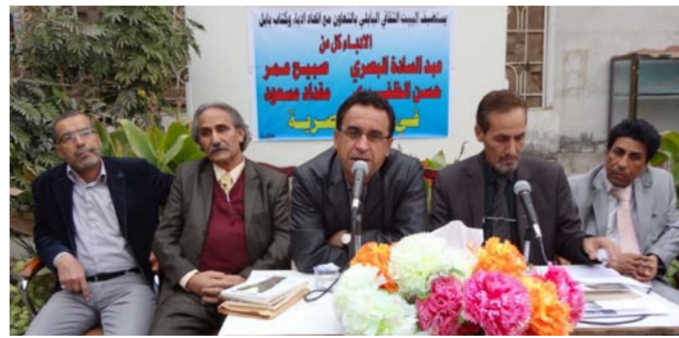
من أجواء الجلسة في بابل

ترسّخ وتؤكّد أهمية الحراك الثقافي في المحافظات العراقيّة.