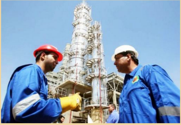
منشأة نفطية عراقية "ارشييف"

في حين تلجأ أوبك لسعر التعادل نيك كانيغهام* على الرغم من إن أسعار النفط عند أدنى مستوياتها في خمس سنوات، إلا أن إنتاج النفط الخام في العراق وصل إلى مستويات قياسية. وعلى وفق ما قال وزير النفط الدكتور عادل عبد المهدي فقد بلغ إنتاج العراق من النفط الخام نحو 4 ملايين برميل يوميا في شهر كانون الأول / ديسمبر. ويعد هذا القفاز من الإنتاج مستو قياسيا للبلد الذي تدمره الحرب، لكن كمية الإنتاج هذه تعد حاسمة لحكومة العراق التي تعتمد على النفط من أجل المصادر على 90 في المئة من عائداتها، وبدلا من أن تقوم الحكومة العراقية بخفض