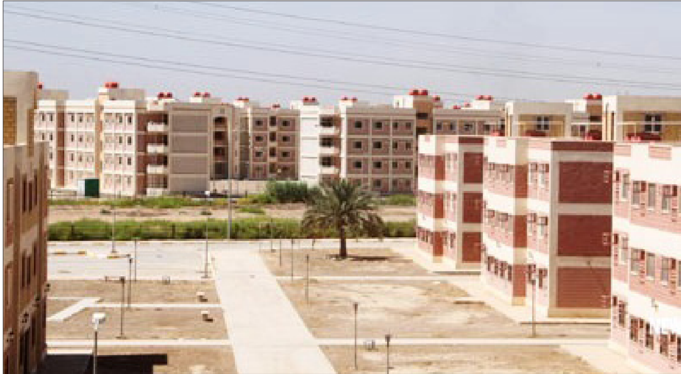
أحد المشاريع السكنية في كركوك

لم تتسلم من كلفة المشروع المالية سوى 12% من قيمة العمل. إلا إن إصراها وسعيها لدعم إدارة كركوك ومواطني المحافظة جعلتهم ينفذون العمل دون النظر للمستحققات». وفي غضون ذلك، جدد محافظ كركوك جُم الدين كرم مطالبته الحكومة العراقية ووزارتي المالية والتخطيط بـ «سرعة صرف مستحققات كركوك من أجل إكمال ما خطط له من مشاريع خدمية»، مشدداً بالقول «إنجاز المشاريع سيخلق فرص عمل لمحابهة الإرهاب ويقوّض من هوة الخلافات السياسية». لافتاً إلى أن «إدارة مجلس كركوك تبذل جهداً كبيراً لضمان توفير المبالغ اللازمة لتمويل المشاريع الخدمية بما يضمن استحققات كركوك والاستمرار بخطط البناء والإعمار». وكان محافظ كركوك قد أشار