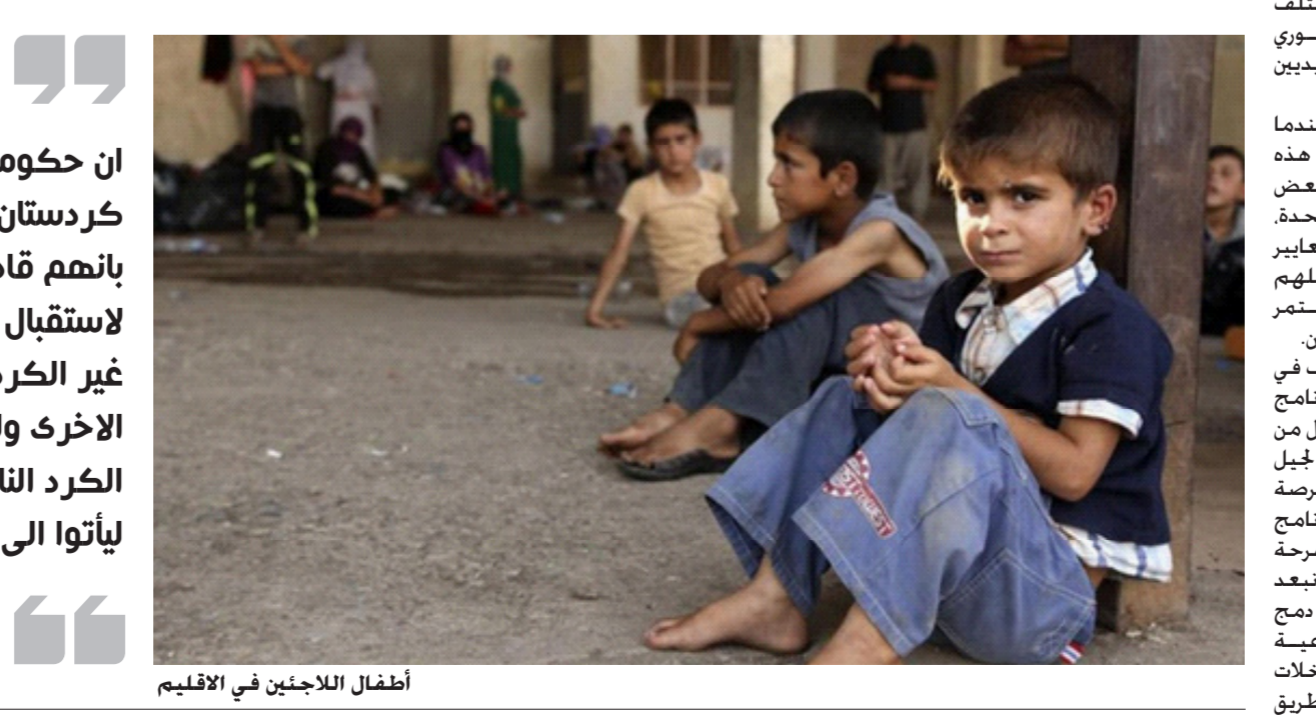
اطفال اللاجئين في الاقليم

التربية والتعليم لحل بعض المشاكل النفسية التي قد تعرض لها الطفل النازح واللاجئ و نحاول ان نعالج هذه الحالات المرضية لدى الطفل. ويجب ان نركز على الامور التكميلية التي يحتاجها الطفل مثل الموسيقى. الرياضة والرسم وغيره من الفنون وتأمين مساحة للطفل للتعبير عن مواهبه وهواياته وحالته النفسية والاجتماعية. وان يتبادل هذه المعلومات مع الاطفال الاخرين والقاصرين. و أشار بابيل الى: ان هذا البرنامج تطبقه في كردستان وخاصة في محافظة دهوك. حيث اننا عملنا مع المجتمع المحلي والحكومة وكان هناك الكثير من الاموال قد انفق على هذا البرنامج لتمامه على اكمل وجه وهناك تعاون كبير بيننا وبين الحكومة ونريد للطفل النازح واللاجئ ان يعود الى التعليم وممارسة الرياضة وحياته الطبيعية وهذا ما يهدف اليه هذا البرنامج.