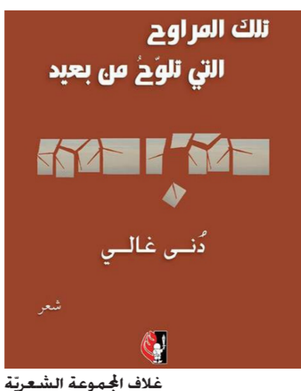
غلاف المجموعة الشعرية