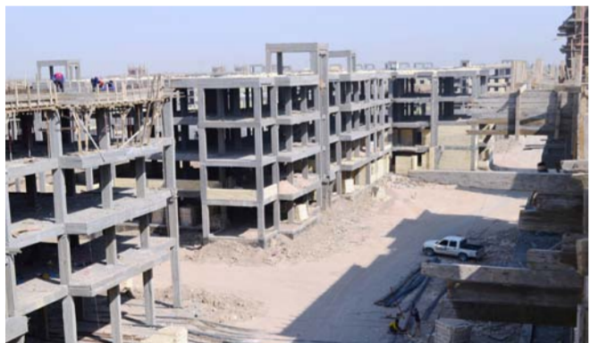
مجمع سكني قيد الانشاء "إر شيف"

في كل طابق مساحة الشقة 116 مترا مربعا والشقة تحتوي على غرفتي نوم ايضا. وبين ان المجمع يحتوي كذلك على ابنية عامة(روضة،حضانة،مدرسة ابتدائية سعة 18 صفا ومدرسة متوسطة سعة 12 صفا عدد 2 اسواق ومركز صحي ومبنى اداري وغرفة حارس عدد 2 مع الشبكات الخ) ونسبة الاجاز في المشروع حاليا 52% . وشبكة تصريف مياه الامطار