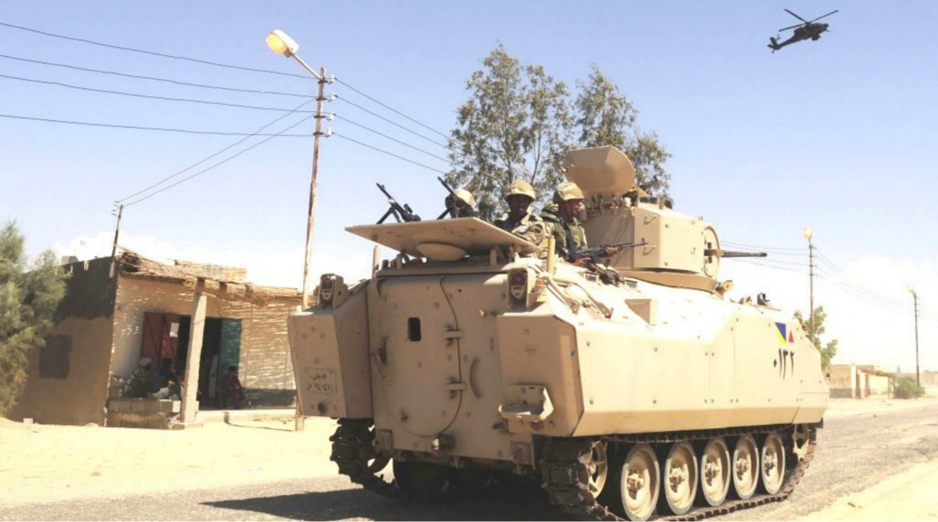
الجيش المصري يعزز وجوده في سيناء ويتعهد بالرد الحاسم على العملية

وتوفي طفلان، أحدهما رضيع عمره ستة أشهر، من الجراح التي أصيبوا بها الخميس بينما كان الجنود يقاتلون المسلحين في قرية قريبة من الشيخ زايد بالقرب من الحدود مع غزة وإسرائيل، وتعد هذه الهجمات اشد هجمات ضد الحكومة تشهدها مصر في الشهور الأخيرة، وتوضح مستوى غير مسبوق من التنسيق، حيثما يقول محللون، وأدانت الولايات المتحدة الهجمات. قائلة إنها "تلتمز بدعمها للحكومة المصرية في جهودها لمكافحة تهديد الإرهاب".