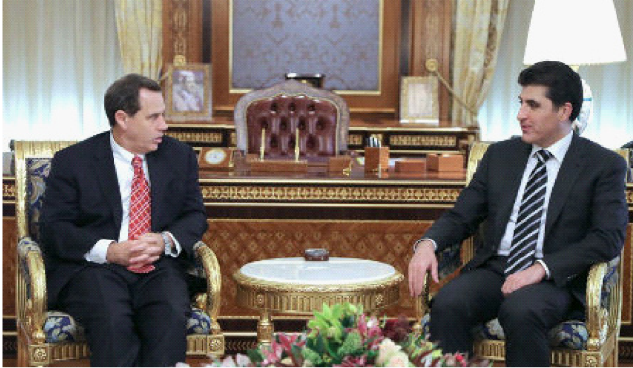
بارزاني مع السفير الأميركي

قوات البيشمركة تقوم حالياً بعمليات تحرير الاقضية والنواحي التابعة للموصل فيما لايزال موضوع تحرير المدينة غير محسوماً بعد