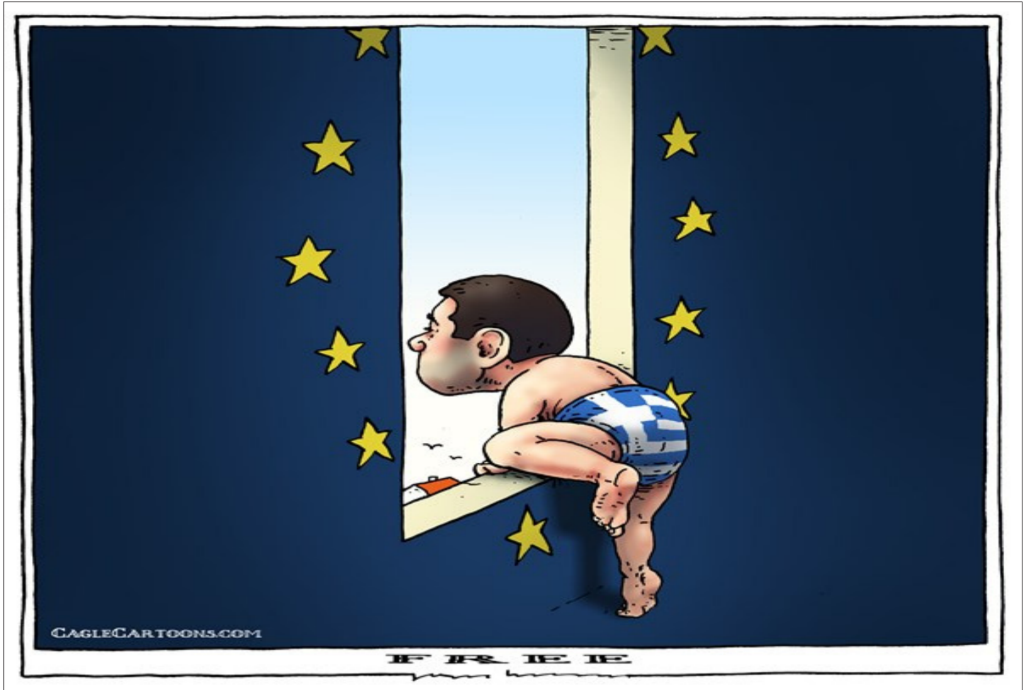
موقع «كارتون سياسي»