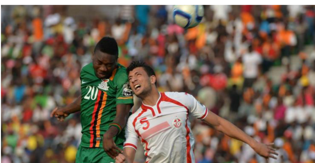
جانب من منافسات أم أفريقيا

وللمرة الثالثة في تاريخ البطولة والأولى منذ عام 1988 خُسم الفرعة تأهل أحد المنتخبات للأدوار الإقصائية وذلك بعدما تساوى منتخبا غينيا ومالي في نفس الرصيد وفارق الأهداف والأهداف المسجلة بالمجموعة الرابعة. ليتم الاحتكام إلى الفرعة وفقاً للائحة البطولة التي اُبتسمت في النهاية لمنتخب غينيا. وتشهد مباريات دور الثمانية العديد من المواجهات الودية. حيث تلقى تونس مع غينيا الاستوائية «مستضيفه البطولة». والكونغو مع جمهورية الكونغو الديمقراطية اليوم السبت، فيما يواجه المنتخب الغاني نظيره الغيني. ويصطدم منتخب الجزائر بمنتخب كوت ديفوار. في مواجهة ثأرية بينهما يوم غد الأحد. ومن المقرر أن يلقي في الدور قبل النهائي الفائز من مباراة تونس وغينيا الاستوائية مع الفائز من مباراة غانا والكونغو بلقني الفائز من مباراة الكونغو والكونغو الديمقراطية مع الفائز من مباراة الجزائر