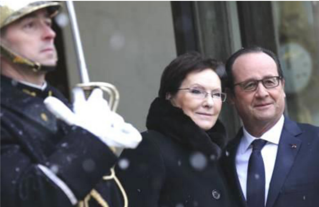
الرئيس الفرنسي اولوند يرحب برئيسة وزراء بولندا أمس الجمعة في قصر الاليزيه في باريس

سلام آباد - رويترز: صرح طبيب إن عدد قتلى انفجار كبير وقع في مسجد للشيعة بمدينة شيكاربور الباكستانية يوم أمس الجمعة ارتفع إلى 40 قتيلاً. وقال الطبيب شوكت ميمون الذي يعمل في مستشفى محلي "ارتفعت حصيلة القتلى إلى 40 قتيلاً لا تزال نضع قوائم بناء على المعلومات الواردة من المواقع القريبة التي نقل إليها المصابون للعلاج"، وأصيب أكثر من 50 في الانفجار الذي وقع أثناء صلاة الجمعة. وتتصاعد العنف الطائفي في باكستان حيث تستهدف الجماعات السنية المتشددة في العادة مساجد الشيعة الذين تعتبرهم كفاراً. ويشكل الشيعة نحو خمس سكان البلاد البالغ عددهم 180 مليون نسمة، وتكررت الشرطة أنه لم يتضح بعد سبب الانفجار الذي وقع في وسط المدينة المزدهم، وذكر نائب اسماعيل ميمون رئيس شرطة شيكاربور "نحاول تحديد طبيعة الانفجار... يفرض فريق للمحققات الموقع". وانهار جزء من المسجد بعد الانفجار ودفن بعض الجرحى تحت الأنقاض قبل أن ينتشلهم المارة.