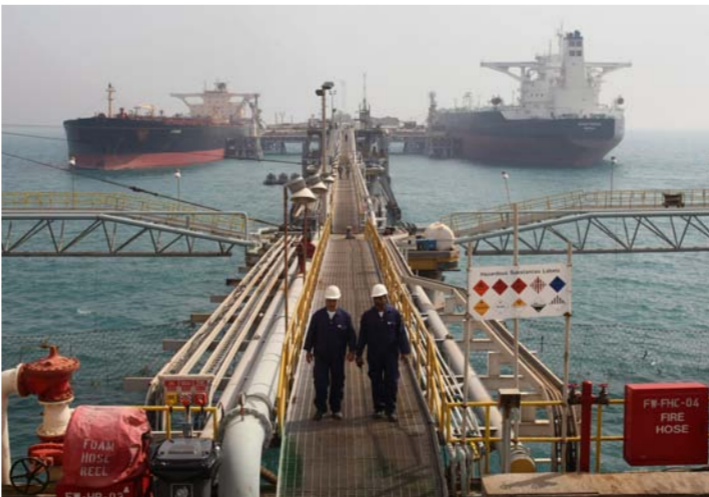
ميناء عالم لتصدير النفط في العراق «إرشيف»

اصدر وزير الداخلية محمد سالم الغبان. أمس الأول الخميس. تعليمات خاصة بحيازة السلاح للمواطنين. تضمنت تسجيل الأسلحة وإصدار إجازة بحيازتها وفق شروط محددة. وجاء في التعليمات التي نشرت. أمس الأول الخميس - على موقع وزارة الداخلية الالكتروني وأطلعت عليها «الصباح الجديد». إن «لكل