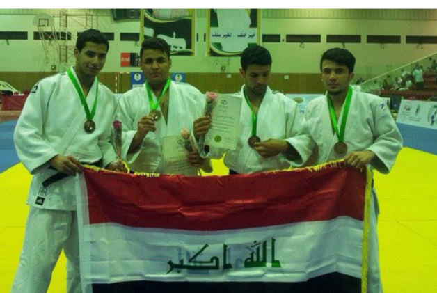
فريق نادي الحر بالجودو