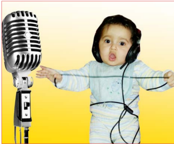
الموسيقا تنمي قدرات الاطفال

وارتبط التدريب الموسيقي أيضاً مع سماكة مناطق الدماغ المرتبطة بالوظائف التنفيذية، وتعطيل المناطق المسؤولة عن العواطف، والسيطرة على الإنتباه. وكذلك التنظيم والتخطيط للمستقبل.