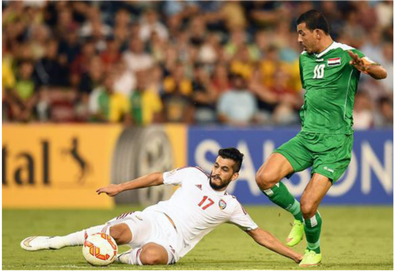
لقطة من مباراة منتخبنا أمام الإمارات أمس