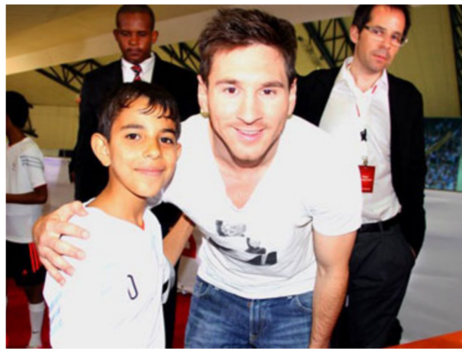
بطل الفيلم يلتقي جمه المفضل

وعالما ما تستهدف الاسواق الدولية للسنيما. وكان «ميسي بغداد» الذي يحرب العنف والحرب فاز بالجائزة الفضية في مسابقة الأفلام الشرق أوسطية القصيرة في الدورة الثالثة عشرة لمهرجان بيروت الدولي للسنيما. ودقت منظمات دولية ناقوس الخطر من انتشار التنشوهات بين صفوف الأطفال العراقيين أثناء الحرب.