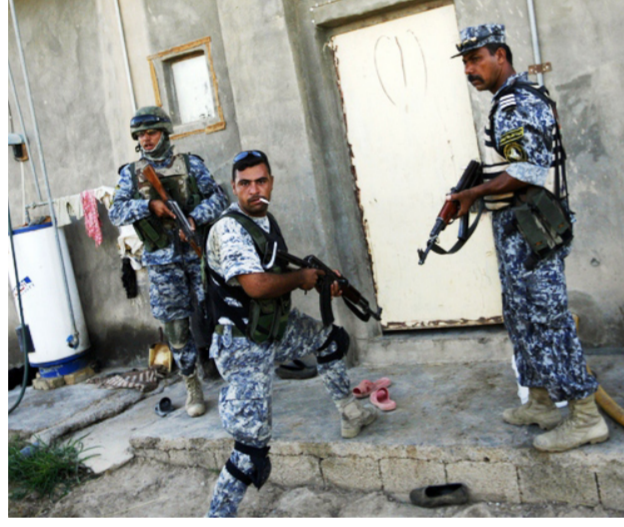
القوات الأمنية في ديالى "ارشييف"