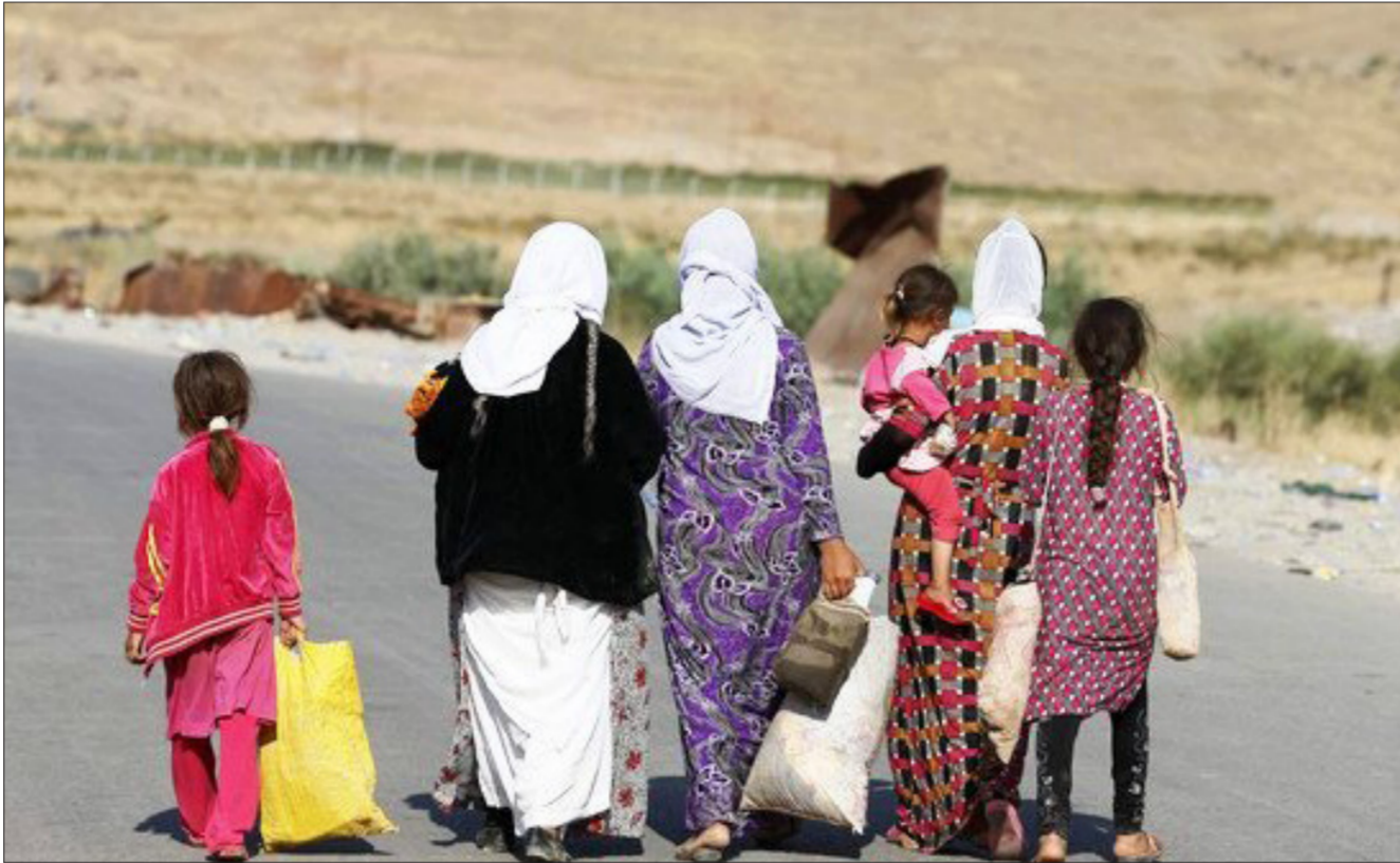
نازحات إيزيديات "ارشياف"