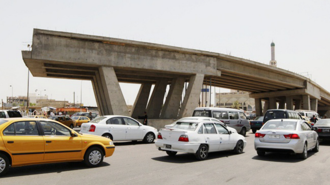
أحد مشاريع الوزارة "إر شيف"

الوطنية للاستشارات التابعة للوزارة وبكلفة تقدر بنحو (15) مليار دينار . يذكر ان البناية الرئيسية والتي تمثل مقبر بطريكية بابل الكلدانية تتكون من ثلاثة اجزاء (A,B,C) يرتبط بينهما مر وتقدر المساحة الكلية للبنية الرئيسية نحو (2م6400) هيكسل خرساني مسلح وبمساحة قدرها 2م2900م وتحتوي على ثلاث قاعات كبيرة الاولى قاعة المناسبات الرسمية والاجتماعات والندوات ومساحة 2م340م وتستعمل للمناسبات.