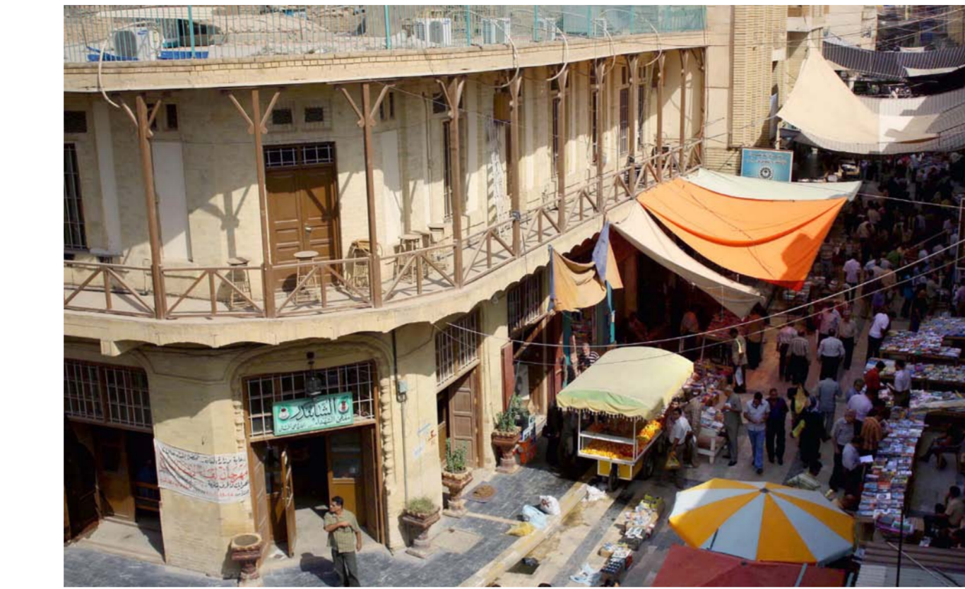
شارع المتنبي ببغداد

حنشل يعتقد أنّ علاقة المثقفين بالبسطيات تحوّرت «لأنّ كثيرين لا يتأون إلى التنبي باستمرار لانشغالهم وعزوفهم عن الشارع الذي صارت فيه الثقافة استعراضية ليس فيها أي عمق معرفي. بل ترسخ الاندماج في المؤسسات السياسية والدينية المهيمنة على مركز القرار». موضوعة العناوين النادرة، تتغير حالها أيضاً بنظره. بعدما «كانت تخر من ثقب إبرة ويوفرها مثقفون من الخارج ويتم تبادلها بصورة سرية خشية الرقيب الأمني. اليوم لا وجود لعنوان نادر، فقد توفرت الكثير من المصادر إلا بعض العناوين التي يشكل العنور عليها مصادفة في بعض البسطيات مثل كتب الفلسفة ودواوين الشعر العالتي والعراقيّ بطبعاتها القديمة». ويؤكد حنشل «بقاء ظاهرة الاستنساخ حتى هذه اللحظة. وخديداً الكتب التي يأخذ المستورد نسبة عليها