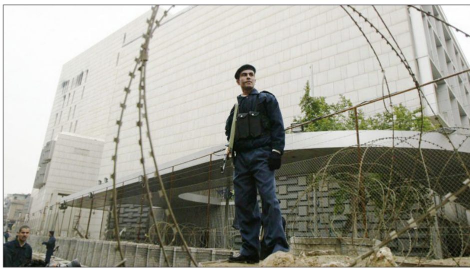
مبنى البنك المركزي العراقي