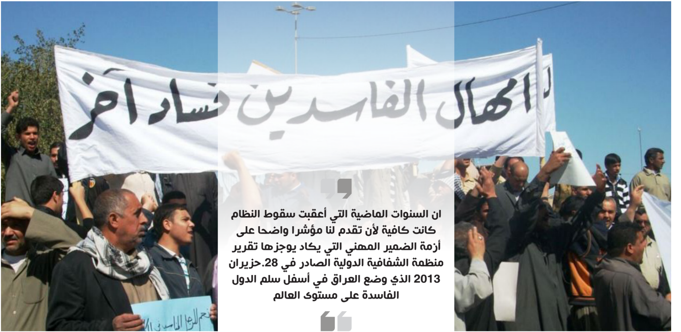
تظاهرة ضد الفاسدين في العراق

ان السنوات العاضية التي أعقبت سقوط النظام كانت كافية لأن تقدم لنا مؤشرا واضحا على أزمة الضمير المهني التي يكاد يوجزها تقرير منظمة الشفافية الدولية الصادر في 28 حزيران 2013 الذي وضع العراق في أسفل سلم الدول الفاسدة على مستوى العالم