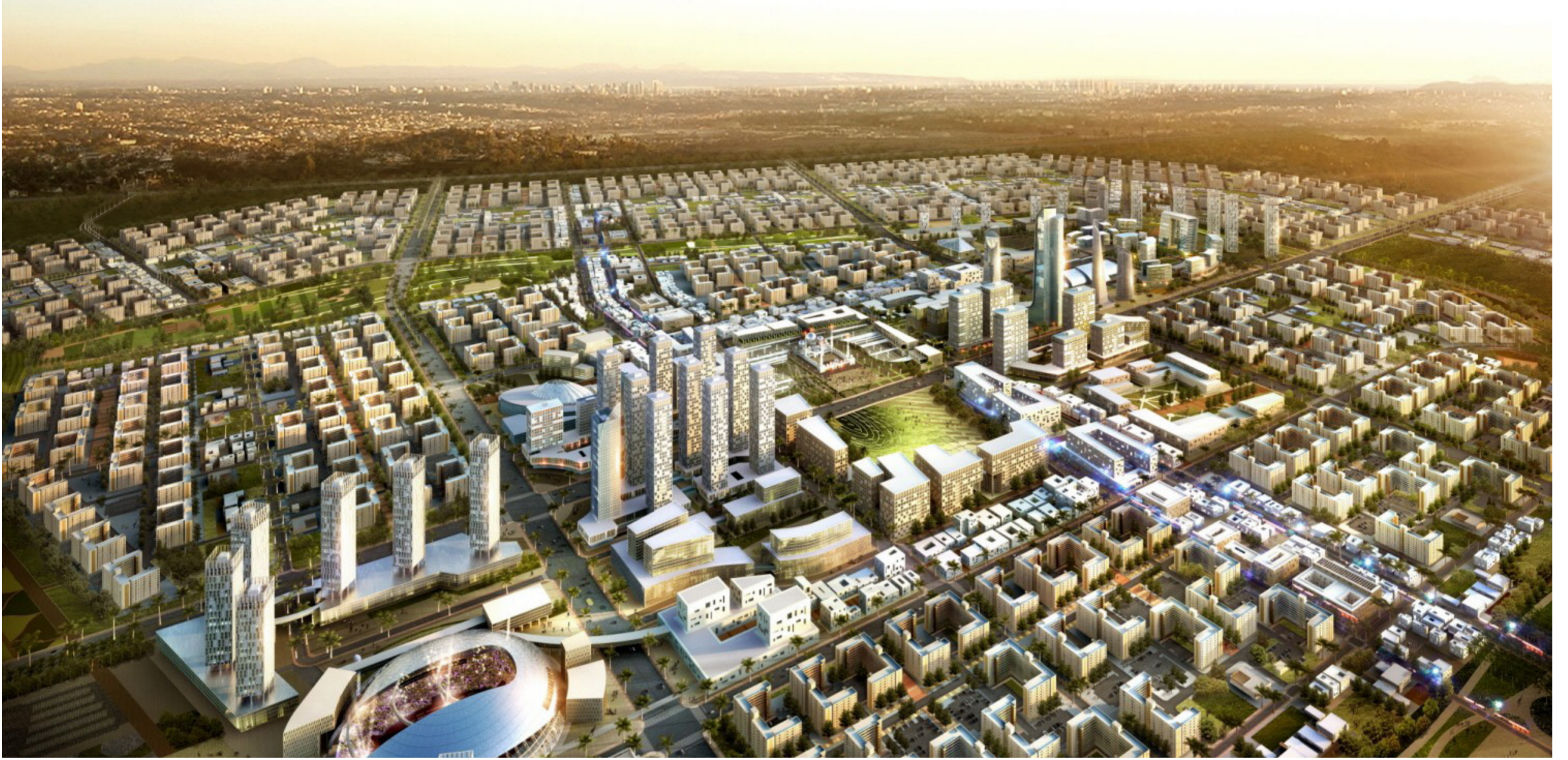
مشروع بسماية السكني