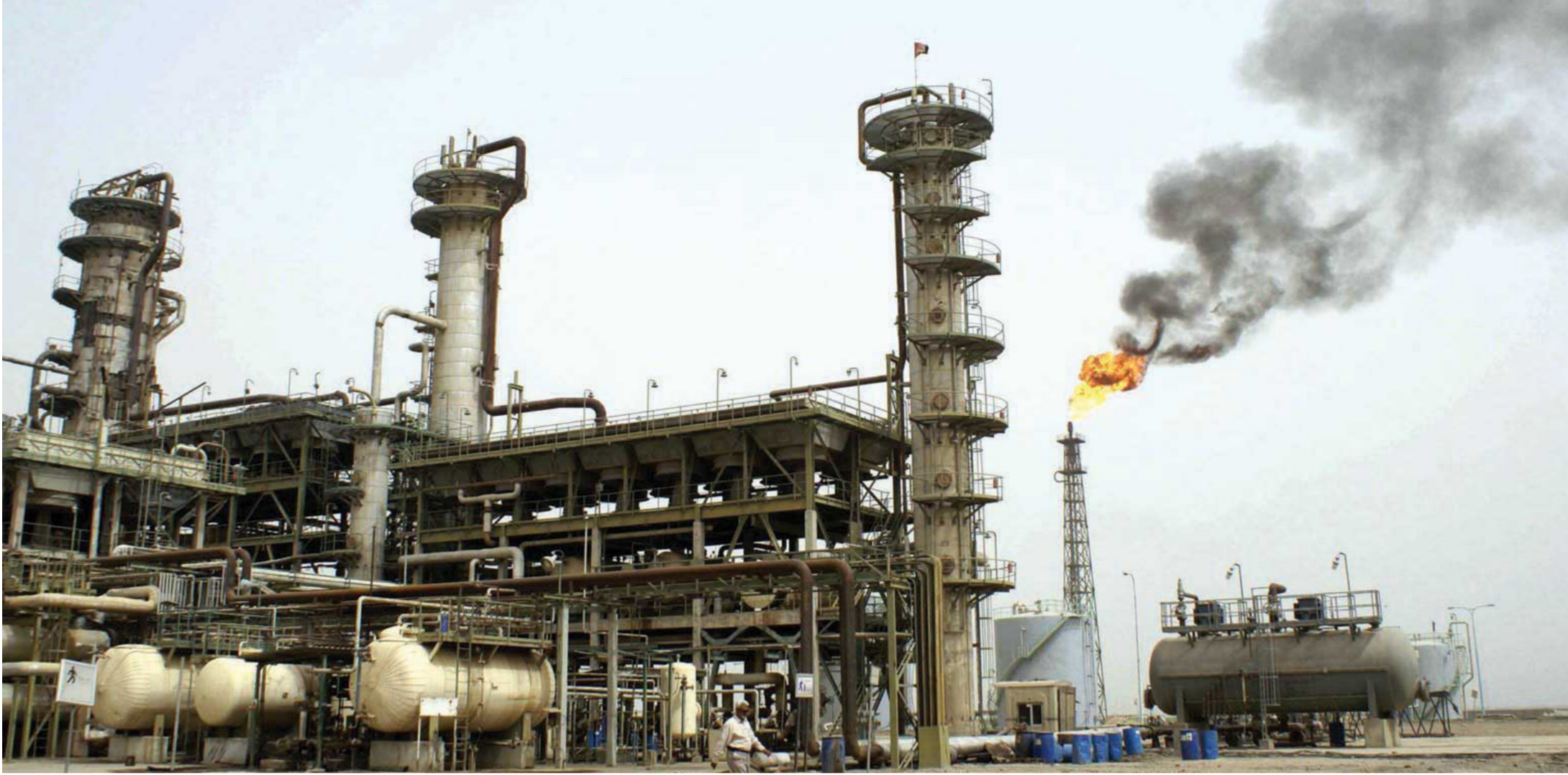
احدى المنشآت النفطية