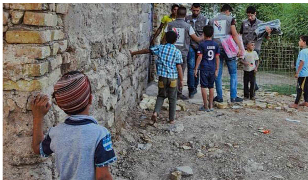
احدى حملات "الشباب البديل"

نقدم منجزات كثيرة. منها: توزيع اكثر من 50 مسرّة. توزيع اكثر من 30 ثلاجة. توزيع اكثر من 25 طباخ. توفير افرشة واعطية وزوليات وغيرها لاكثر من 20 عائلة. توزيع 25 مروحة سقفية. عمومية. توزيع مواد طبخ على 20 عائلة. العناية الخاصة بالحالات المرضية المرمنة والجرحة وفحص 50 حالة وتوزيع الدواء الخاص بهم ايضاً. توزيع صيدليات منزلية. توزيع حوم حمراء بما يقارب 160 كيلو لحم. وتوزيع حوم بيضاء 150 دجاجة. توزيع حليب اطفال وحفظات لاكثر من 100 طفل. غسل 8 مدارس وتهيئتها بالتعاون مع المنظمات الانسانية والهلال الاحمر لاحتواء العائلات النازحة. توزيع الملابس لاكثر من 250 ثياباً. توزيع اكثر من 200 سلة غذائية متكاملة. توزيع مبالغ مالية وصلت الى 4 ملايين واكثر.