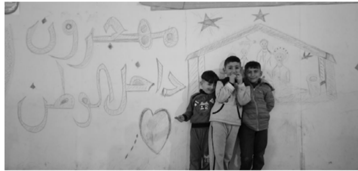
مهاجرون داخل الوطن

خصوصاً الطلبة «العرب» الذين يواجهون مشكلات كبيرة في الالتحاق بمدارس الإقليم. التي بدت لا تستقبلهم. بحسب ما يروي أولياء أمورهم.