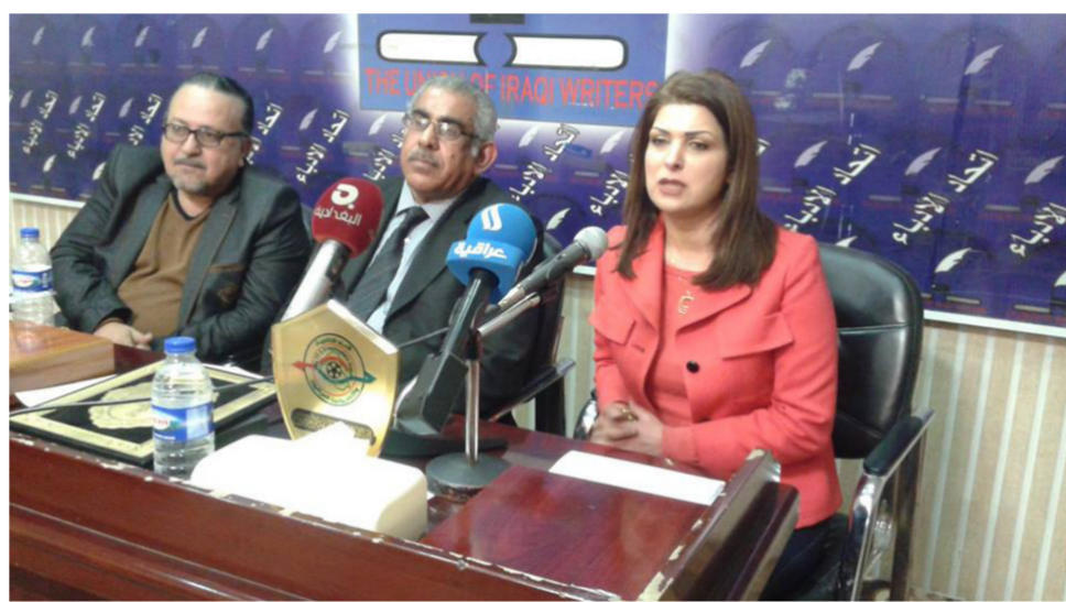
جانب من حفل التكريم