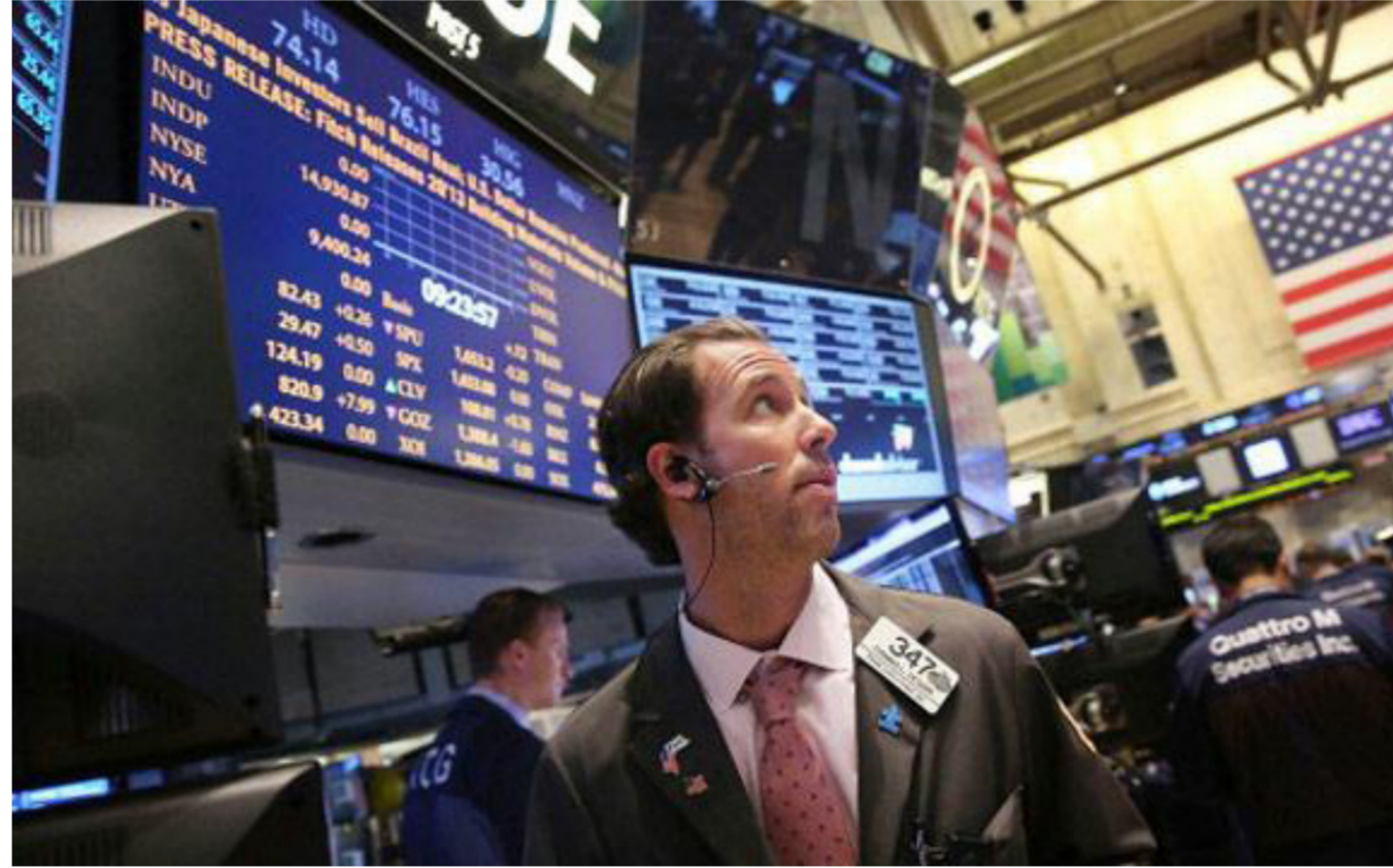
سوق الأسهم الأمريكية

إن شبه الركود العالمي الذي شهدته عام 2014 كان من صنع الإنسان. فهو نتيجة للسياسة والسياسات في العديد من الاقتصادات الكبرى — السياسة والسياسات التي خنقت الطلب، وفي غياب الطلب، تفشل الاستثمارات وفرص العمل في التحقق. الأمر بهذه البساطة. ولم يكن هذا الأمر أشد وضوحاً ما هو عليه في منطقة اليورو، التي تبنت رسمياً سياسة التضخف — خفض الإنفاق الحكومي الذي أدى إلى تفاقم حالة الضعف في الإنفاق الخاص، وتحمل بنية منطقة اليورو جزيئاً المسؤولية عن إعاقة التكيف مع الصدمات التي ولدتها الأزمة؛ ففي غياب الاتحاد المصرفي، لم يكن من المستغرب أن يفر المال من البلدان الأشد تضرراً. الأمر الذي أضعف