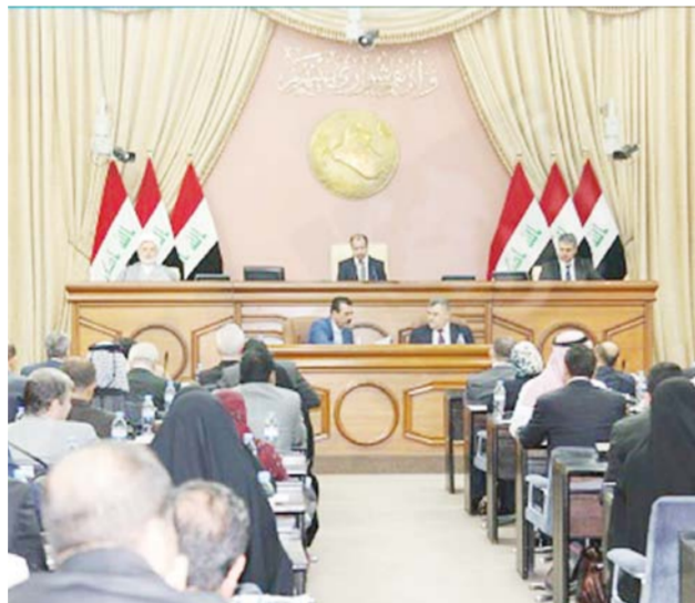
مجلس النواب "ارشيف"