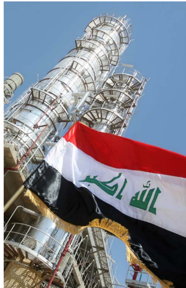
أحدى المنشآت النفطية العراقية

لدراسة أسعار النفط وأسعار صرف النقد الأجنبي، بما في ذلك الإشراف على قسم للبحوث يضم أشخاصاً موهوبين يحاولون التنبؤ بتحركات هذه الأسعار. وقد تركتني هذه التجربة مع قدر كبير من الشكوك — ناهيك عن الإحباطات. لكنني أعتقد أنه من الممكن الخروج بتكهن عرض النطاق حول اتجاه أسعار النفط. على مدار مسيرتي المهنية، حاولت خدي ما إذا كان هناك ما يسمى بسعر توازن النفط، وقد انقضت ساعات طويلة في محاولة توجيه وتملق واستجداء محللي الطاقة لدي لكي يعملوا على إنشاء نموذج قادر على خديده. كما فعلنا مع العملات، وعائدات السندات، والأسهم، كما ناقشت الفكرة مع خبراء الصناعة، والذين يعتقد أغلبهم أن سعر توازن النفط موجود، ولكنه يتحرك كثيراً لأنه يتأثر بشكل كبير بالتكاليف الهامشية لإنتاج النفط — وهو ذاته متغير غير مستقر.